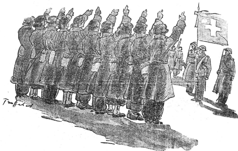
Rotkreuzfahrerinnen - (Eidesleistung) Conductrices de Croix-Rouge - (Prestation du serment)

Vom 11.—21. März findet in der Kaserne Basel ein Kaderkurs für Rotkreuzfahrerinnen statt.