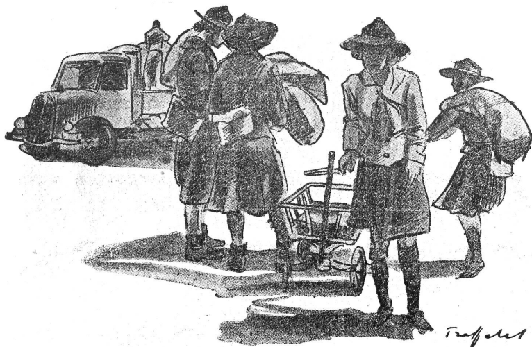
Pfadfinderinnen sammeln Spitalmaterial bei der Bevölkerung Eclaireuses, collectant du matériel d'hôpital