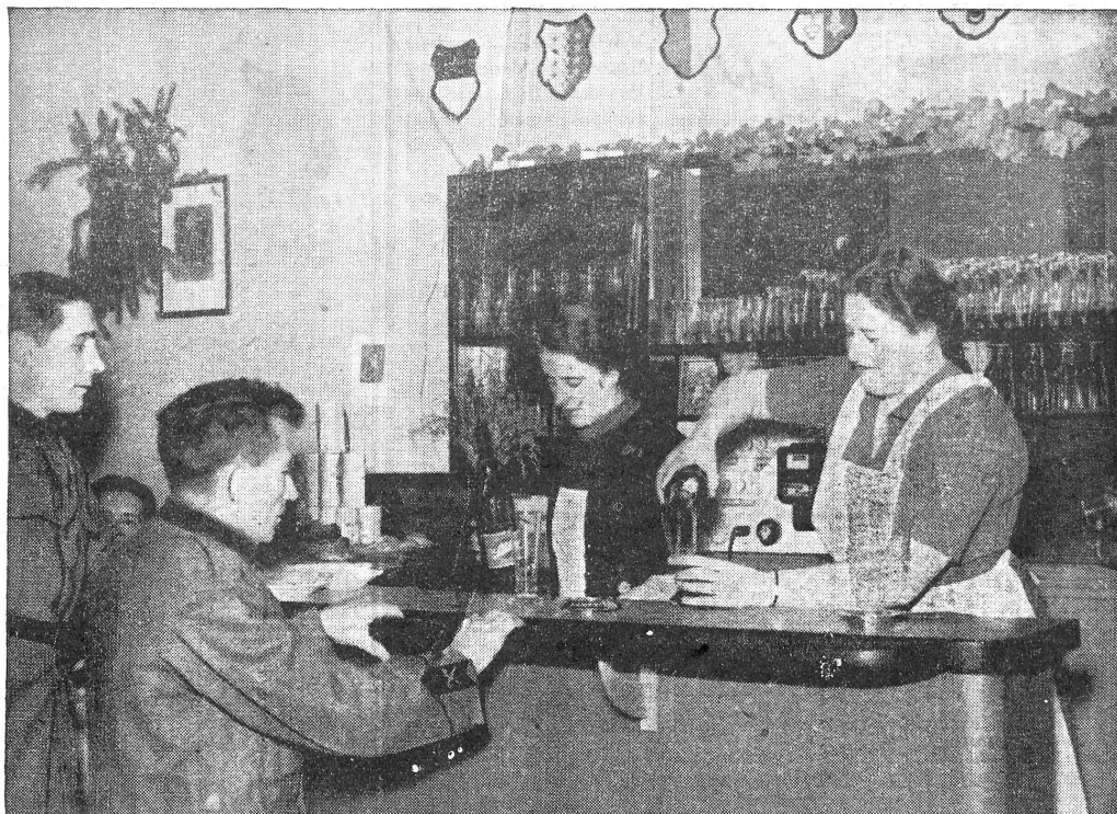
Fürsorgeeinrichtung in der M. S. A. Bar in der Soldatenstube Kontr. VI/H 0216

Matratzen und Kissen wurden mit Holzwole und Heu gefüllt. Das Sanitätspersonal leistete tüchtige und flotte Arbeit.