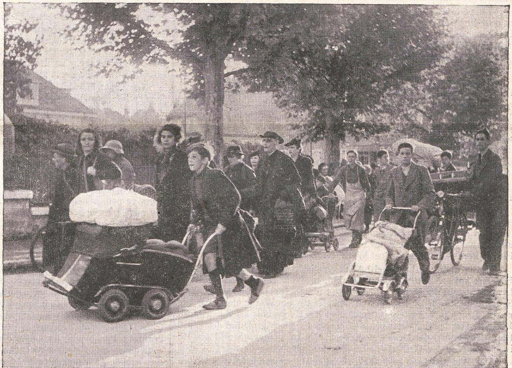
Flüchtlinge aus Frankreich strömen durch die Strassen der schweizerischen Grenzorte. Zensur Nr. III 1464 My.

Es gibt kein Heilmittel gegen die Nervosität unserer Zeit als mutige Umkehr auf die Bahn eines kraftvollen Idealismus, dem kein Menschheitsziel zu hoch an den Sternen steht. (Marcinowski.)