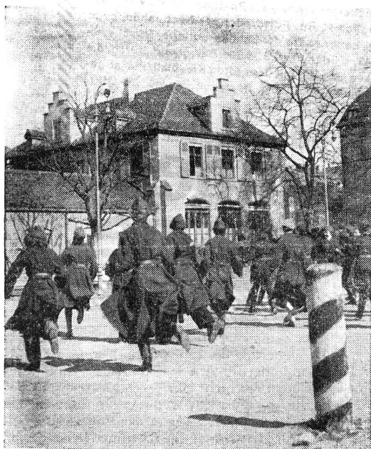
Kaderkurs für Rotkreuzfahrerinnen. 11.—21. März Antreten!