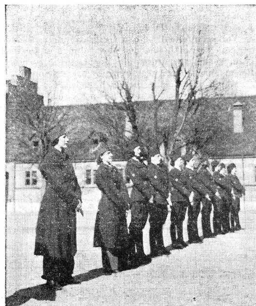
Kaderkurs für Rotkreuzfahrerinnen. 11.—21. März. — Rotkreuzfahrerinnen! Achtung!