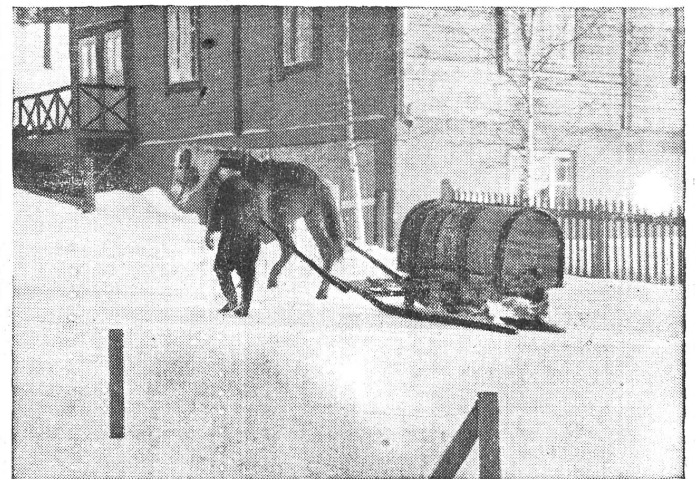
Finnland. Wasserversorgung des improvisierten Spitals in Lohja

Im übrigen verlief das Leben in Helsinki ruhig. Tagelang gab es überhaupt keinen Fliegeralarm, und kam einer, so setzte dies keine Aufregung ab, sondern man begab sich in aller Ruhe und Gemächlichkeit.