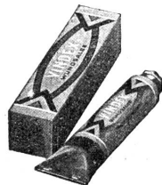
Vindex-Wundsalbe in Tube

„FLAWA“, Schweizer Verbandstoff- u. Wattefabriken AG., Flawil