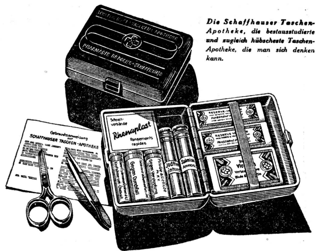
Die Schaffhauser Taschen-Apotheke, die bestausgestattete und zugleich hübscheste Taschen-Apotheke, die man sich denken kann.