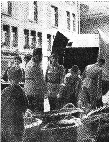
Raccolta di frutta e verdura per la Croce-Rossa. Massaie e contadine, pensate ai nostri soldati!

Più d'una contadina o d'una massaia ammira quei chiari visi di adolescenti e si sente riscaldare da quel sorriso che è tanto più gradito