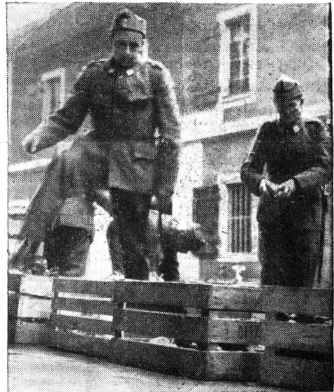
Colonna di soldati intenta alla cernita.

in quanto un pò la ripaga della mancanza di sole di questi giorni autunnali. Quasi per ringraziarle di tale piccola gioia, tutte frugano nelle loro ceste e riempiono le mani, le braccia, le cartelle delle giovinette di frutta e di verdura a destinazione dei nostri soldati colpiti da infermità.