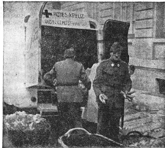
Es geht noch viel hinein!

Die Körbe und Kisten füllen sich. Diese Farben! Durch den Nebel dringen ein paar Sonnenstrahlen. Die Kolonnenleute schieben volle Körbe in den schwarzen Leib des Lieferwagens. Die Münstererglocken läuten den Mittag ein, und die Bäuerinnen packen zusammen. Zwei Pfadfinderinnen ziehen die letzte Ladung zum «Hauptquartier».