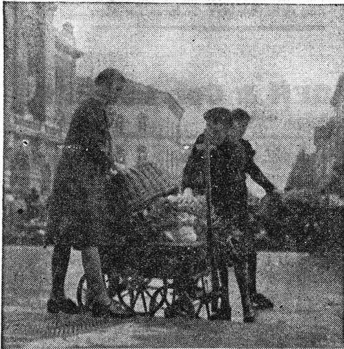
Wieder ein voller Wagen!

Das «Hauptquartier» besteht aus einem grossen Lieferwagen; Riesenkirschen sind mit verschwenderischem Rot darauf gemalt.