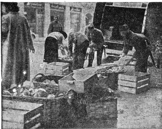
Kolonnen-soldaten helfen beim Sortieren

Kolonnen-soldaten nehmen mit Kennerblick jedes heranrollende Wägelchen in Empfang und helfen den Pfadfinderinnen beim Sortieren der Gaben. «Halt! In diesen Korb nur die Rüben; Salat in die Kiste dort! Ja, hier die Äpfel; Berner Rosenäpfel! Fein!» Leere Leiterwagen rattern wieder weg.