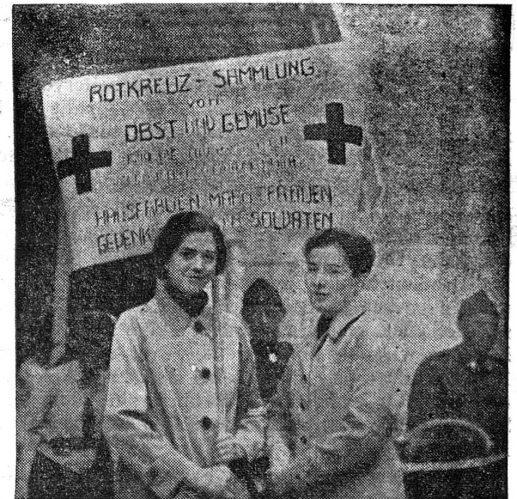
Rotkreuz - Sammlung von Obst u. Gemüse. Hausfrauen u. Marktfrauen, gedenkt der Soldaten!

Manch eine Bäuerin oder Hausfrau schaut in die hellen Gesichter und wird selbst ein wenig warm dabei, weil das Sonnige gar nicht in den trüben Tag passt und doch so willkommen ist. Sie greift in ihren Korb und füllt die ausgestreckten Arme, Kistchen und Schulmappen: Früchte und Gemüse für die kranken Soldaten. (Fortsetzung auf der letzten Seite)