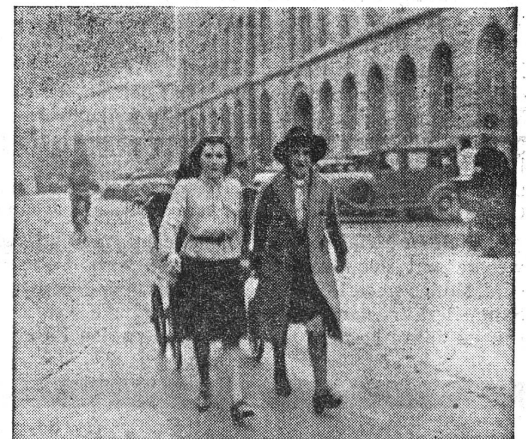
Wartet, wir bringen noch etwas!