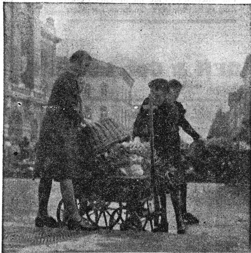
Wieder ein voller Wagen!

Das «Hauptquartier» besteht aus einem grossen Lieferwagen; Riesenkirschen sind mit verschwenderischem Rot darauf gemalt.