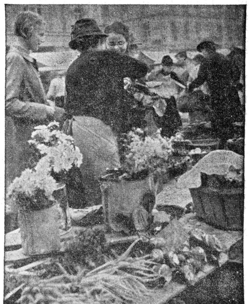
Hat diese Bäuerin wohl auch einen Sohn im Militär- dienst?