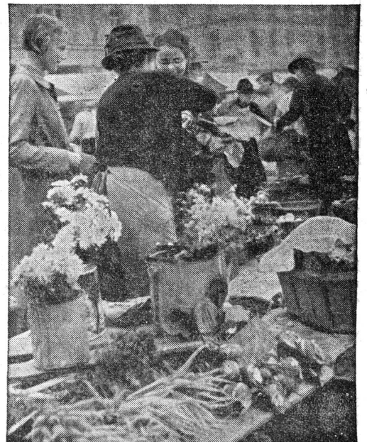
Hat diese Bäuerin wohl auch einen Sohn im Militärdienst?