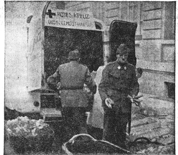
Es geht noch viel hinein!

Die Körbe und Kisten füllen sich. Diese Farben! Durch den Nebel dringen ein paar Sonnenstrahlen. Die Kolonnenleute schieben volle Körbe in den schwarzen Leib des Lieferwagens. Die Münsterglocken läuten den Mittag ein, und die Bäuerinnen packen zusammen. Zwei Pfadfinderinnen ziehen die letzte Ladung zum «Hauptquartier».