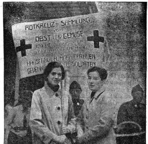
Rotkreuz - Sammlung von Obst u. Gemüse. Hausfrauen u. Markt- frauen, gedenkt der Soldaten!

Manch eine Bäuerin oder Hausfrau schaut in die hellen Gesichter und wird selbst ein wenig warm dabei, weil das Sonnige gar nicht in den trüben Tag passt und doch so willkommen ist. Sie greift in ihren Korb und füllt die ausgestreckten Arme, Kistchen und Schulmappen: Früchte und Gemüse für die kranken Soldaten. (Fortsetzung auf der letzten Seite)