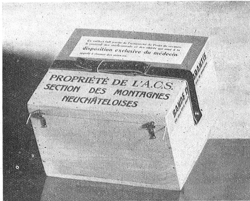
Le service routier de la Section des Montagnes neuchâtelaises de l'A. C. S.