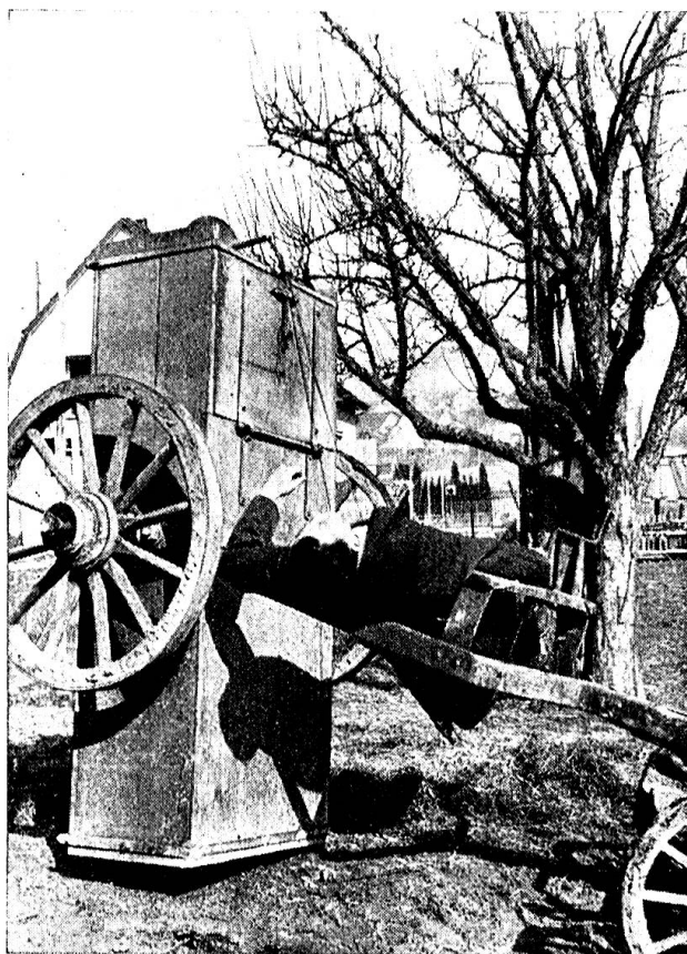
L'accident qui a rompu les reins au conducteur.

raboteuse; soudain sa main fut prise dans la machine, happée par la scie. Et la main de la fillette y resta.