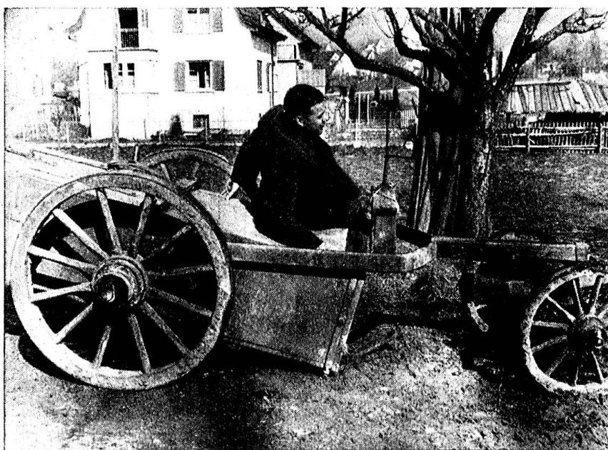
La caisse à purin traine à terre.