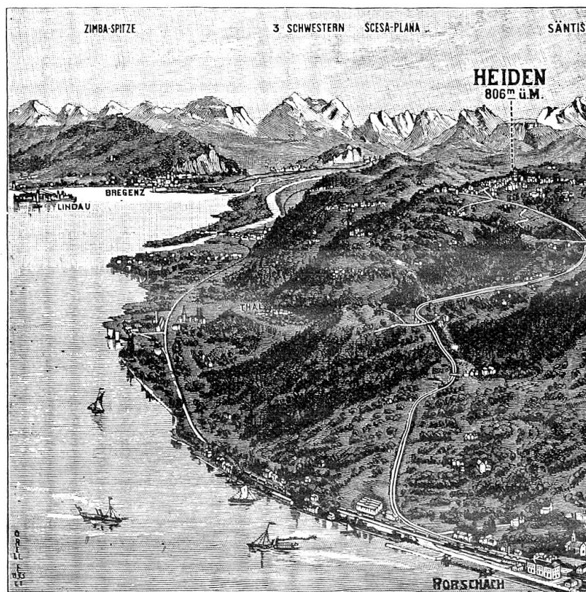
Heiden vom Flugzeug aus.

Sonntag nachmittag: Gruppenweise Spaziergänge in die aussichtsreiche Umgebung. Picknick im Kurpark oder in der Kurhalle.