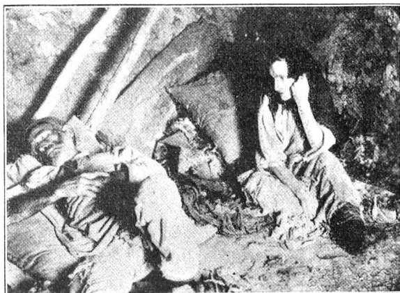
In einer Mauerecke Schutz vor Kälte suchend, erhoffen die Hungernden Hilfe. Vergebens! Der Satte geht dem ewigen Schlaf entgegen, die Frau wird ihm wohl bald folgen

fehlt es quantitativ nicht; man staunt, wenn man hört, daß für diese Kinderzahl 72 Angestellte „tätig“ (?) waren. Ihre Zahl wurde denn sofort reduziert. Die Qualität läßt aber auch so zu wünschen übrig, so daß die Dele-