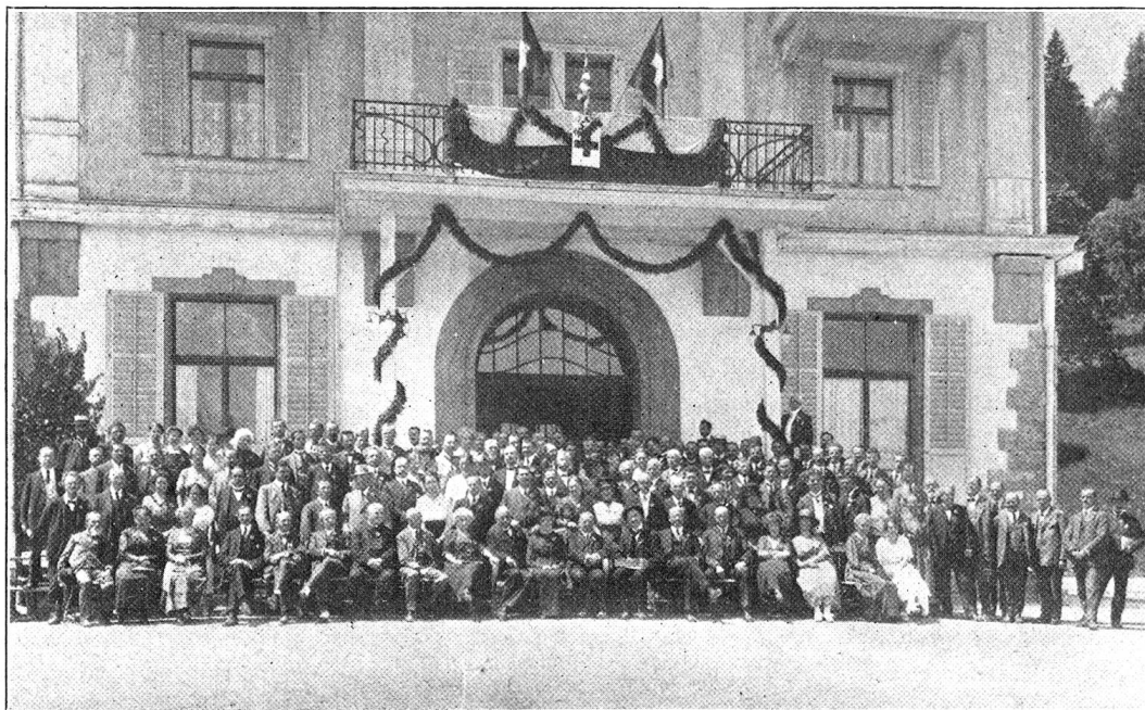
Delegierte und Gäfte des Schweizerischen Roten Kreuzes vor dem «Grand Hotel Braunwald»

„Nur ungern trennten sich die Rotkreuzler von dem wunderschönen Fleck Erde“, schreibt der Berichtersteller des „Näfelser Volks-