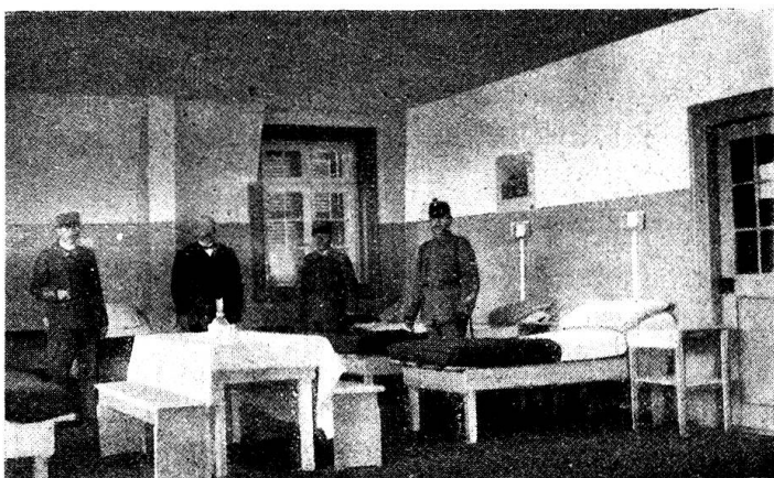
Zentralkurs in Worb. ~ Fertiges Krankenzimmer.

Es wurde vorgeschlagen, man sollte Kurse für die Unteroffiziere einrichten. Ich glaube nicht, daß dies der richtige Weg wäre. Sicher senden viele Kolonnen Leute in den Kurs, um sie nachher zu Unteroffizieren zu machen, wenn diese Leute etwas gelernt haben. Wir