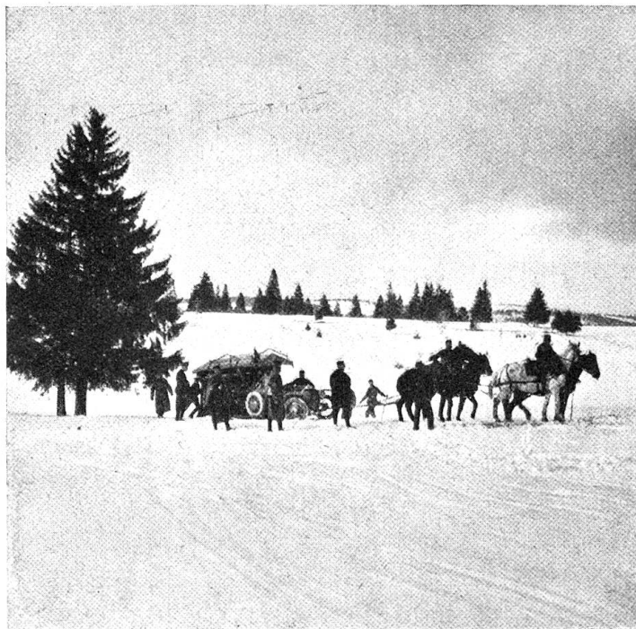
Vom Verfuhrkurs. — Energische Nachhülfe.

ich, ich kann nicht anders". Im Hintergrund sieht man die andern Autos in Kolonne folgen. Allein auch da weiß man, sich zu helfen.