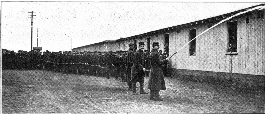
Aus den Gefangenslagern Deutschlands. — Spritzenprobe.

etwas monoton aussehen, aber den hygienischen Anforderungen entsprechen sollen. Das zweite