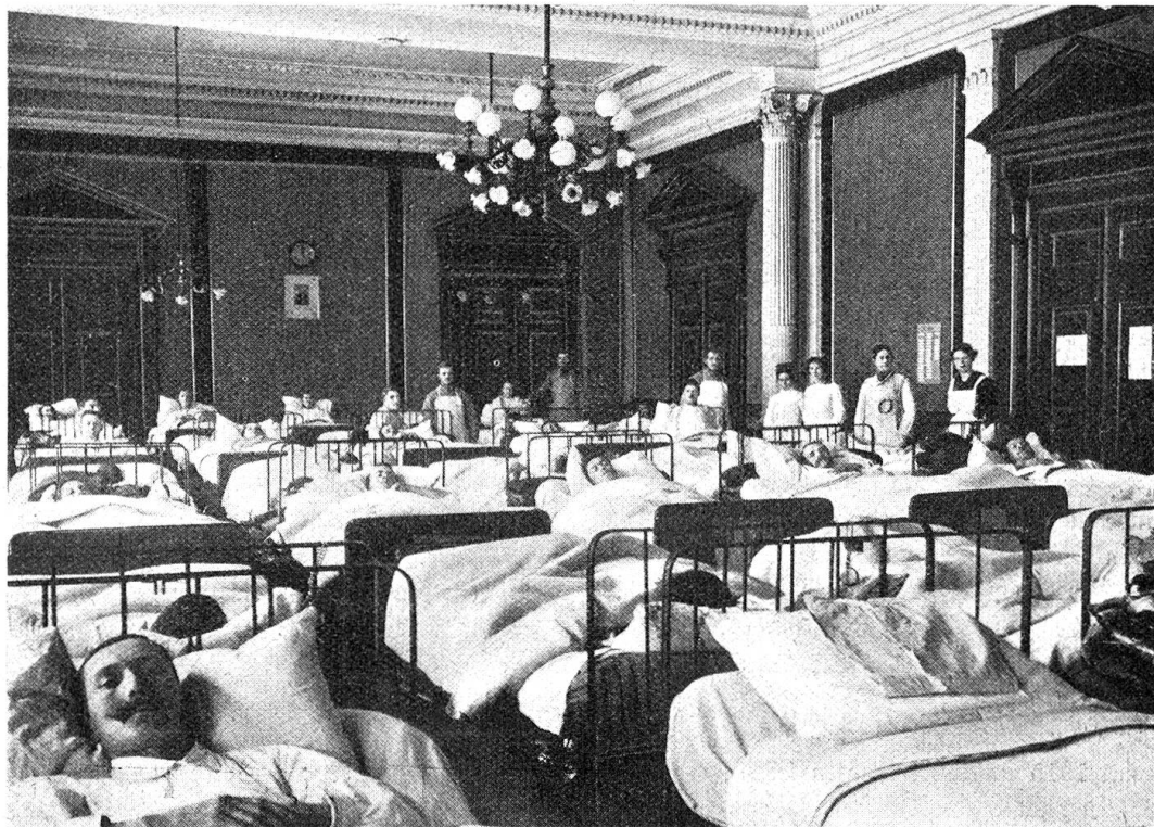
Aus der Etappen-sanitätsanstalt Solothurn.

das Podium mit Krankenbetten belegt sind. Die Lagerstätten sind verschieden, man sieht den Typus des gewöhnlichen Eisenbettes,