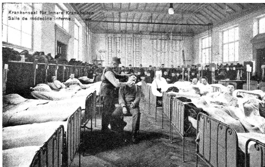
Aus der Etappensanitätsanstalt Olten.