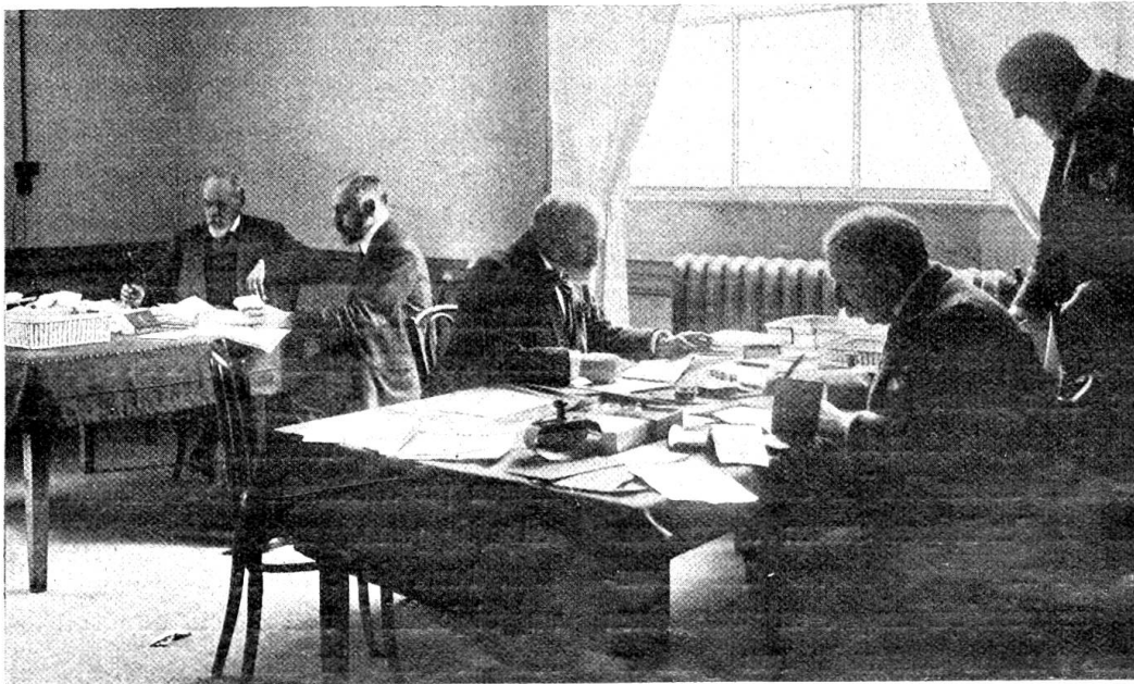
Die Mitglieder der Agentur für Kriegsgefangene an der Arbeit.