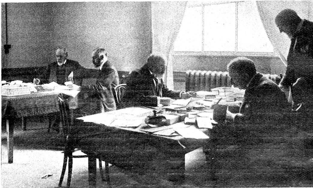
Die Mitglieder der Agentur für Kriegsgefangene an der Arbeit.