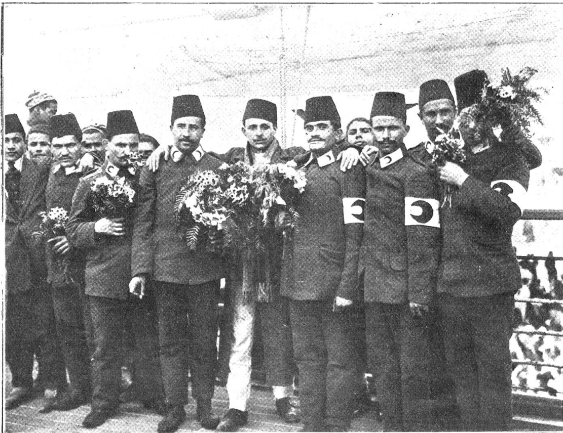
Die Mitglieder des Roten Halbmondes werden vor ihrer Abfahrt nach dem Kriegsschauplatz von ihren Brüdern aus Tunis mit Blumen geschmückt.

auf seine Lazarettfahne pflanzen. Bei so | gedrungenerweise unheiljame Verwirrung ent- mannigfaltigen Abzeichen müßte aber not- | stehen: —