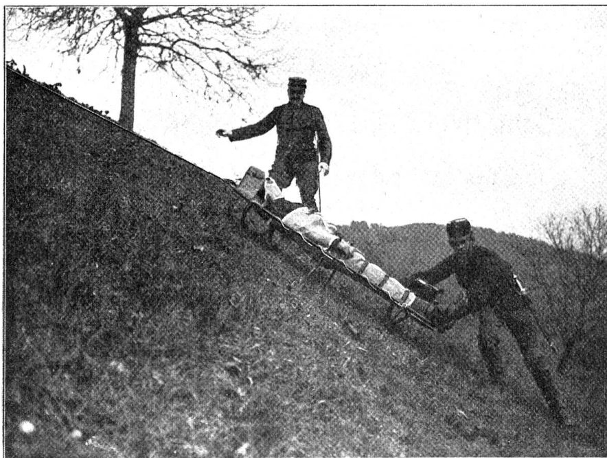
Fig. 1. Schlittenbahre nach Dr. Lardy als Schlitten.

Auf ebenem Boden oder auf gut gangbaren Steigungen, kann der Schlitten durch zwei Längshölzer von reichlicher Länge, die entweder immer beim Schlitten belassen werden oder im Notfall rasch aus jungen Bäumen, Hopfenstangen, Garten- oder sonstigen Zaunlatten zc. hergestellt werden können, in eine leicht und angenehm transportable Tragbahre umgewandelt werden. Auch hier beansprucht der Transport nur zwei Mann, insofern die Hölzer lang genug gemacht werden. (Fig. 2.)