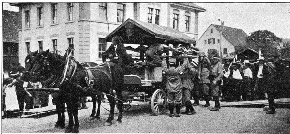
Hauptverbandplatz Pratteln. Verladen durch die Sanitätshilfskolonne Basel.

Um 10 Uhr 50 kehrte das erste Fuhrwerk mit Verwundeten beladen von Gempfen zurück, in kurzen Zwischenräumen folgten auch