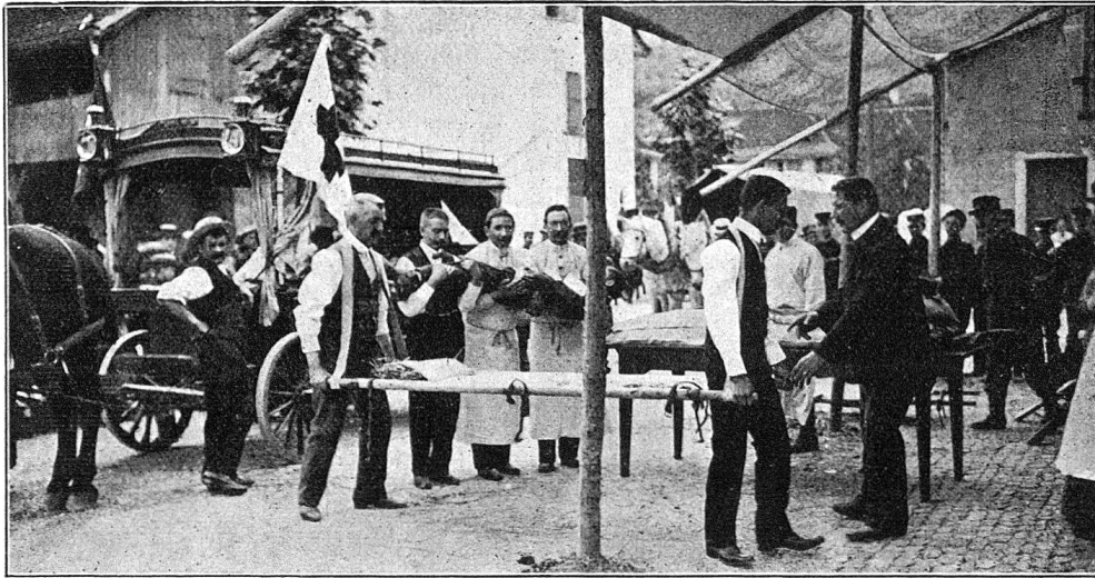
Hauptverbandplatz Pratteln. Empfangsstelle. Abladen.

während die beiden andern am Vorabend von den Samaritern in Muttentz und Pratteln erstellt worden waren, und am Morgen dem Hauptverbandplatz durch eine supponierte Meldung vom Korpslazarett 2 zur Verfügung gestellt wurden. Das in Pratteln zurückgebliebene Personal machte sich sofort an die Einrichtung des Hauptverbandplatzes, welcher