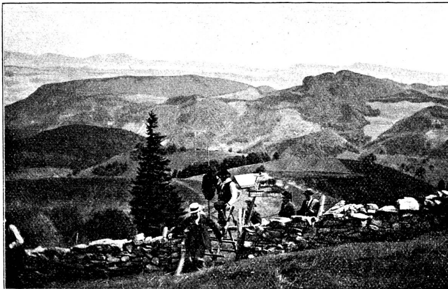
Eine Trägerrotte auf dem Weg zur Feuerlinie.

Kilchzimmer, zu dem uns der Zutritt von der Diakonissenanstalt Riehen in zuvorkommenster Weise gestattet worden war, der Truppenverbandplatz eingerichtet, die Em-