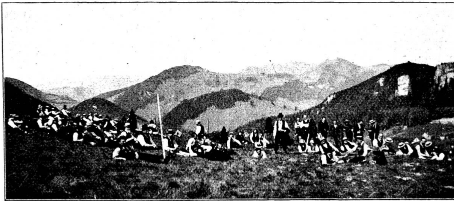
„Zünni“ auf dem Bölchensattel.

sition zu erklären. Weiter ging's von hier auf steinigten steilen Waldwegen längs der Nordseite der „Bölchenfluh“ gegen den Sattel am Fuße der „Bölchenfluh“ (P. 995), wo die Kolonne nach anstrengendem Marsche in guter Ordnung programmgemäß gegen zehn Uhr eintraf. Auf lustiger Bergeshöhe (1000 m. ü. M.) in einer der schönsten Gegenden unseres Jura wurde bei herrlichstem Frühlingswetter „Zünnirast“ gehalten. Doch dauerte das fröhliche Lagerleben nur kurze Zeit.