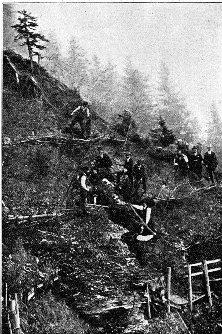
Praktische Übung des Samaritervereins Brienzwiler.

arbeiten ausgeführt. Ein bei genannter Arbeit zugetragener Unfall wurde supponiert. Ein Arbeiter hat einen Beinbruch und Verletzungen am Kopfe erlitten und wird nun von seinen Kameraden, mit Notverbänden versehen, auf einer improvisierten Schlittenbahre aus Tannästen zu Tal befördert. Die Verband- und Transportübungen wurden geleitet von den Herren Dr. Baumgartner und Sanitätswachtmeyer Linde, beide in Brienz. Den Übungen folgten auch einige Damen, die unserem Verein angehören.