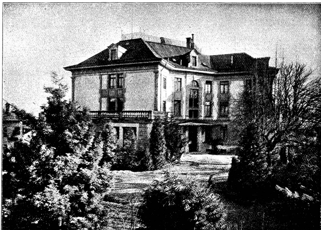
Die Privatklinik Lindenhof des Roten Kreuzes.

Wir wollen heute wieder einmal berichten über die vom Zentralverein vom Roten Kreuz im Jahr 1899 geschaffene Rot-Kreuz-Pflege-