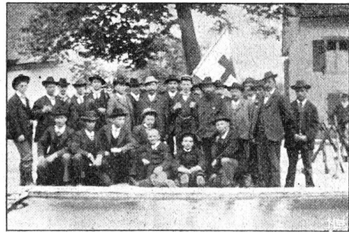
Die Teilnehmer an der Übung.

Ein Bataillon des Regiments, dem eine Ambulanz beigegeben ist, steht bei Büren, um dem Vordringen des Gegners über Nuglar-St. Pantaleon entgegenzutreten.