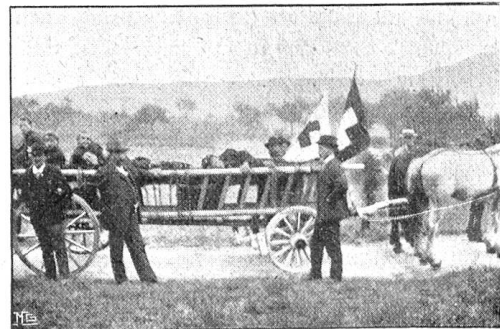
Leiterwagen für 6 Liegende.

Die Durchführung begann mit dem Antreten morgens 7 Uhr beim Bahnhof Liestal; Abmarschpunkt 7 \frac{1}{2} Uhr als supponierter Rückzug über Nuglar-