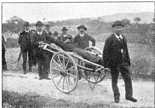
Milchkarren als Käderbahre.

genommen wurde; kurz nachher traf die Meldung ein, daß eine schwächere feindliche Kolonne von Ruglar heraufmarschierte.