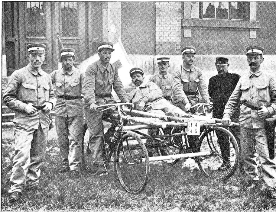
Improvisierte Fahrbahre, hergestellt aus zwei gewöhnlichen Velo.

100 Mann zählte. Für diesen Rückgang sind zweifellos mehrere Gründe vorhanden. Einmal ist die Bildung von Sanitätshilfskolonnen in der Schweiz erst im Anfang und die große Mehrzahl der Vereine hat sich noch nicht ernsthaft diesem wichtigen Gebiete gewidmet. Dann ist von verschiedenen Seiten geklagt worden, daß Leuten, die den Kurs mitzumachen beabsichtigt hatten, der nötige achttägige Urlaub vom Geschäft nicht erteilt wurde und schließlich ist es begreiflich, daß zahlreiche