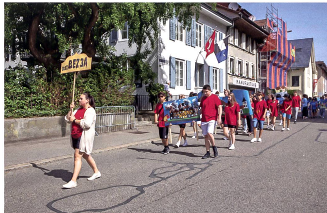
Die letzte Bez-Klasse am Jugendfest 2022.

Alles begann am Montag, 11. Januar 1836, als die Bezirksschule im 1828 erbauten Rat- und Schulhaus eröffnet wurde. 2 Hauptlehrer und 22 Schüler bildeten den ersten Jahrgang. Im Mai stiessen 9 weitere Schüler dazu, darunter solche aus Oftringen und Rothrist. Im Jahr 1843 wurde das Fach Latein eingeführt. Wegen verschiedener Schwierigkeiten, darunter vor allem mangelndes Interesse, wurde das Angebot nach kurzer Zeit wieder aufgegeben. Auch sonst waren die Anfangsjahre geprägt von Schwierigkeiten. Die hohe Fluktuation in der Lehrerschaft war eines der Probleme. Der Festschrift «100 Jahre Bezirksschule Aarburg» ist zu entnehmen, dass sich beispielsweise Lehrer Rauchenstein an die Kantonsschule in Aarau versetzen liess.