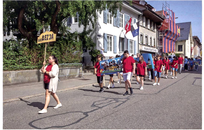
Die letzte Bez-Klasse am Jugendfest 2022.

Alles begann am Montag, 11. Januar 1836, als die Bezirksschule im 1828 erbauten Rat- und Schulhaus eröffnet wurde. 2 Hauptlehrer und 22 Schüler bildeten den ersten Jahrgang. Im Mai stiessen 9 weitere Schüler dazu, darunter solche aus Oftringen und Rothrist. Im Jahr 1843 wurde das Fach Latein eingeführt. Wegen verschiedener Schwierigkeiten, darunter vor allem mangelndes Interesse, wurde das Angebot nach kurzer Zeit wieder aufgegeben. Auch sonst waren die Anfangsjahre geprägt von Schwierigkeiten. Die hohe Fluktuation in der Lehrerschaft war eines der Probleme. Der Festschrift «100 Jahre Bezirksschule Aarburg» ist zu entnehmen, dass sich beispielsweise Lehrer Rauchenstein an die Kantonsschule in Aarau versetzen liess.