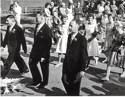
Über Jahrzehnte prägten die «3 B» – Brack, Brunner, Byland – das Gesicht der Bez Aarburg.

forderte Mindestzahl von 36 Schülerinnen und Schülern pro Jahrgang bis dann nicht erreicht werden kann.