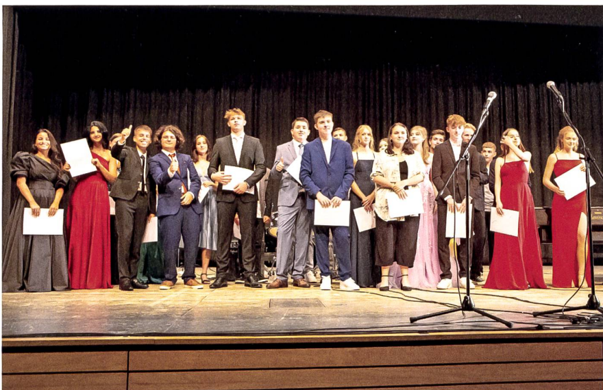
An der Zensurfeier 2022 wird die letzte Klasse der Bezirksschule Aarburg verabschiedet.

Die einschneidendste Phase folgte vor drei Jahren. Im Zofinger Tagblatt vom 11. April 2019 heisst es: «Aarburg schliesst Bezirksschule definitiv.» Vorausgegangen waren Gespräche und Bemühungen, die Bezirksschule in Aarburg zu behalten. Trotz des Bevölkerungswachstums erreiche die Schule die Mindestzahl Schüler nicht, um weiterhin eine eigene Bezirksschule betreiben zu können, schrieb die Schulpflege in einer Mitteilung. Positive Hochrechnungen bis zum Ende der vom Kanton gewährten Übergangsfrist 2021/2022 zeigten laut der Mitteilung, dass die ge-