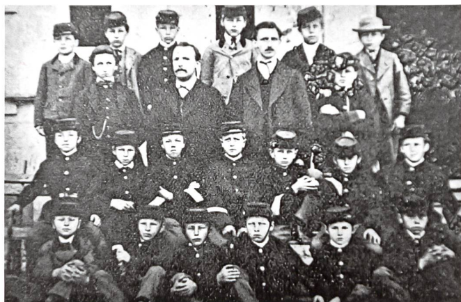
Die erste Bez-Klasse im Schuljahr 1873/74.

Im Juni 1835 beschlossen die Aarburger Ortsbürger und Einwohner die Umwandlung der bestehenden Knaben-Realschule in eine Bezirksschule. Im gleichen Jahr wurde die Bezirksschulpflege gewählt. Damit gehörte Aarburg zu den ersten zehn Gemeinden, die im Laufe des Schuljahres 1835/1836 eine Bezirksschule besassen.