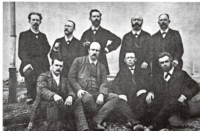
Haupt- und Hilfslehrer 1896.