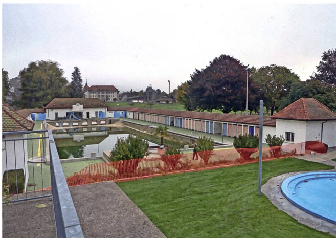
Das Freibad vor der Sanierung im Herbst 2020 ...

Sprungturm gedient hatte. In den folgenden Jahrzehnten erfolgten weitere kleinere Unterhalts- und Reparaturarbeiten, bis schliesslich rund 90 Jahre nach der Erbauung auf Beschluss der Aarburger Bevölkerung eine umfassende Sanierung anstand. Im Hinblick darauf beantragte die Gemeinde Aarburg, die sich der historischen und baukulturellen Bedeutung ihrer Badi wohl bewusst war, die kantonale Unterschutzstellung. Diese wurde im Februar 2022 rechtskräftig. Somit konnten die in Zusammenarbeit mit der Kantonalen Denkmalpflege geplanten Umbau- und Sanierungsarbeiten von der Epprecht Architekten AG, Aarburg (Architektur), und der Jenzer+Partner AG, Aarberg/Crissier (Schwimmbadtechnik), von Herbst 2021 bis Sommer 2022 durchgeführt werden. Die Ausführung der Arbeiten wurde eng von der Kantonalen Denkmalpflege begleitet. Der Kanton Aargau und die Eidgenossenschaft unterstützten die denkmalgerechte Sanierung finanziell. Als Grundsatz für die Baumassnahmen zur technischen Modernisierung galt, dass das Freibad sein ursprüngliches Erscheinungsbild bewahren respektive dieses möglichst wiederhergestellt werden sollte. So umfassten die Haupteingriffe die denkmalgerechte Restaurierung der originalen Bausubstanz, die Rekonstruktion der nicht mehr erhaltenen Bauteile gemäss Befund, die Neuerstellung des nicht mehr schutzfähigen Bassins, einen Neubau des Technikgebäudes, eine Neuorganisation der sanitären Einrichtungen innerhalb der