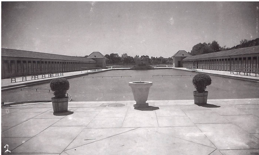
Blick vom Eingangsgebäude gegen Südwesten 1931.

wasser entnehmen zu können. Während die ersten Badeanstalten dieser zweiten Generation stilistisch noch dem Neoklassizismus verpflichtet waren und das Prinzip der geschlossenen Anlage in Anlehnung an die Kastenbäder übernahmen, zeigen die bunten Freibäder des Neuen Bauens offenere Gesamtdispositionen. In beiden Fällen gehörten zum architektonischen Programm neben dem Bassin, den Garderoben und dem Kasengebäude auch Liegewiesen und Verpflegungsmöglichkeiten. Ab der Mitte des 20. Jahrhunderts kamen vielerorts Infrastrukturen für Sport und Spiel sowie Erlebnisbecken und Wasserattraktionen hinzu und die früheren Badeanstalten wurden Bestandteil einer neuen, vielfältigen Freizeitarchitektur.