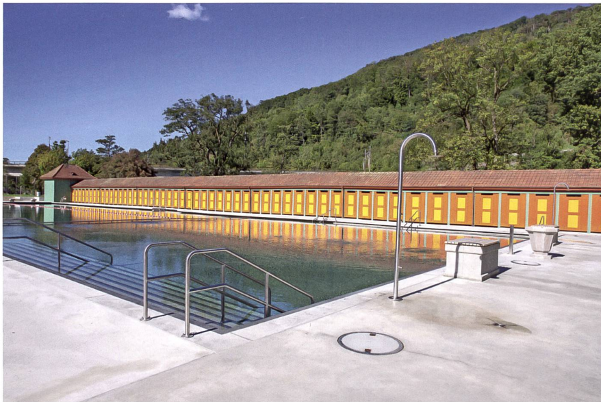
Blick gegen Westen zu den Umkleidekabinen mit den neuen Türen in bauzeitlicher Farbigkeit.

Eine der augenfälligsten Neuerungen ist die Wiederherstellung der bauzeitlichen Farbigkeit der Aarburger Badeanstalt. Im Rahmen der Sanierung konnten dank eines restauratorischen Farbuntersuchs die originalen Farben der verschiedenen Gebäudeteile festgestellt werden. Zum Vorschein kam eine bunte, kräftige Farbpalette, die für die Bauzeit durchaus typisch ist und sich bei zeitgleich entstandenen Bauten findet, so auch bei Freibädern im Stil des Neuen Bauens. In Aarburg ist die Farbigkeit subtil abgestuft: Während sie am Aussenbau eher gedämpft und zurückhaltend zu den umliegenden Bauten wirkt, leuchtet sie im