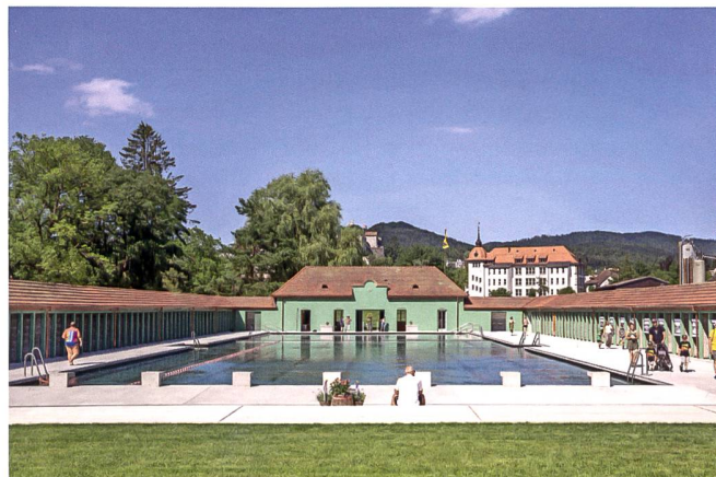
... und am Eröffnungstag. Noch sind die neuen Türen nicht montiert.