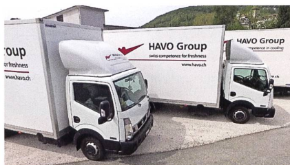
Um ihre Kunden optimal bedienen zu können, unterhält die HAVO einen eigenen Fuhrpark.

system geführt und verwaltet. Dies ermöglicht dem Kunden eine komplette Übersicht über sämtliche Geräte mit aktuellem Standort sowie eine Gerätehistorie. Diese Daten kann der Kunde zur eigenen Verwendung weiterverarbeiten. Der Kunde hat darüber hinaus die Möglichkeit, Aufträge für Logistik und Reparaturen auf der eigenen HAVO-Plattform online zu erfassen. Geräte, welche er ans Lager retourniert, werden einem kurzen Funktionstest unterzogen und mittels werterhaltenden Trockeneises gereinigt und wieder eingelagert.