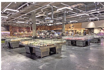
Der neue Coop-Megastore im Perry Center wurde mit IDA-Inseln der HAVO Group AG beliefert.

HAVO bietet alles aus einer Hand: Lagerung, Transport, Montage, Reinigung und Rebrandings von Kühl- und Warmhaltegeräten. So werden beispielsweise Kühlgeräte von Red Bull, Froneri (Mövenpick, Frisco) sowie Unilever (Ben & Jerrys, Lusso) von der HAVO Group AG auf einer Fläche von 16'000 m 2 gelagert und schweizweit an die entsprechende Verkaufsstelle geliefert. Jedes Gerät verfügt über eine eigene Identifikationsnummer und wird im Bestandesmanagement-