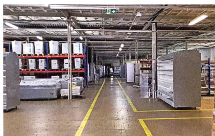
Blick in eine der Lagerhallen.