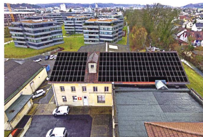
Erste Solarzellen auf dem Dach der Lagerhalle der HAVO Group AG.

den Strom über die Solaranlage zu beziehen. Wenn möglich soll in naher Zukunft auch eine öffentlich zugängliche E-Tankstelle entstehen.