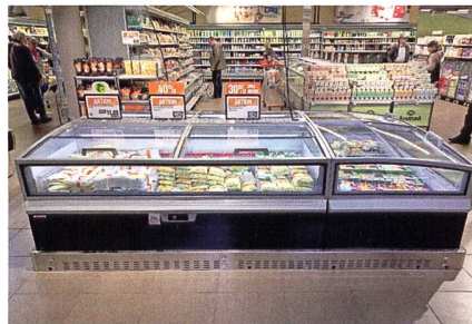
AHT-Supermarkttruh sorgen für eine attraktive Warenpräsentation.