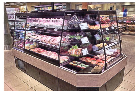
Brandneue Convenience-Inseln CALEO beleben die Verkaufsstelle.