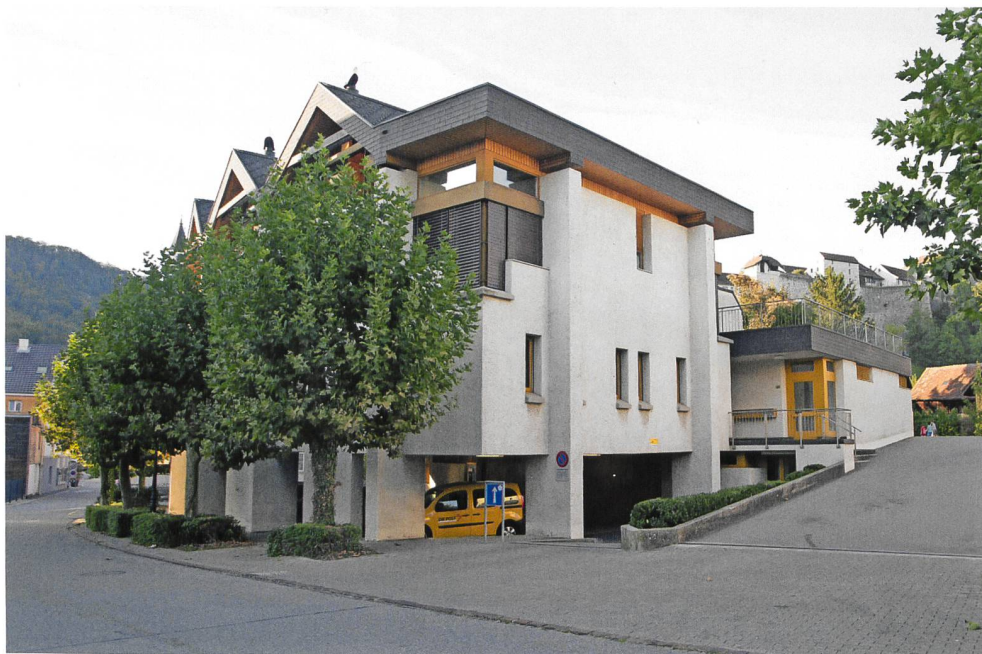
Der Neubau an der Pilatusstrasse 7 war Standort des Postamtes Aarburg von 1981–2013. Heute starten hier die Zustellenden für Aarburg und Rothrist ihre Touren.

Der Transportvertrag mit der Stadtomnibus AG, Olten, wurde abgeschlossen. Die Postbeförderung mit Anhänger wurde am 6. Mai 1946 aufgenommen. Täglich