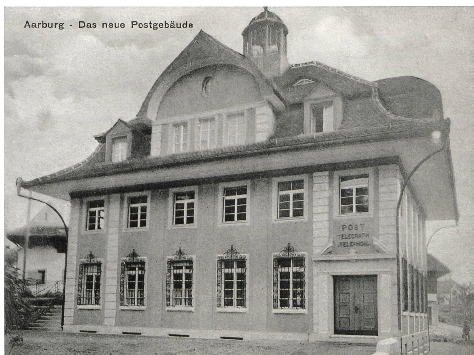
In diesem Gebäude an der Stampfeschachstrasse (heute Pilatusstrasse 5) war die Post 1911–1981 untergebracht.

Als Nachfolger für den verstorbenen Postoffizianten Aerni wählte die Postdirektion den Hutmacher Isak Zimmerli. Seine Besoldung betrug in den ersten Jahren 700 Franken, dann wurde sie auf 600 und später sogar auf 450 Franken herabgesetzt. In