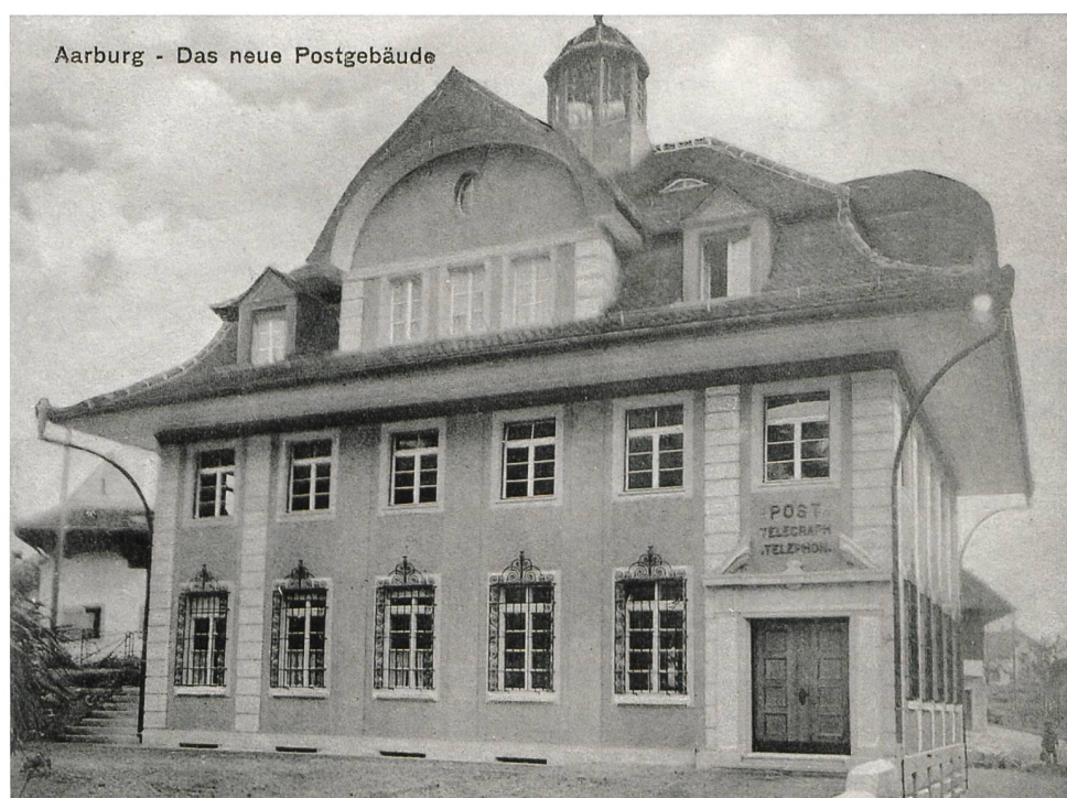
Aarburg - Das neue Postgebäude