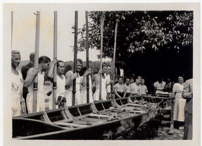
Bootstaufe im Jahre 1937.