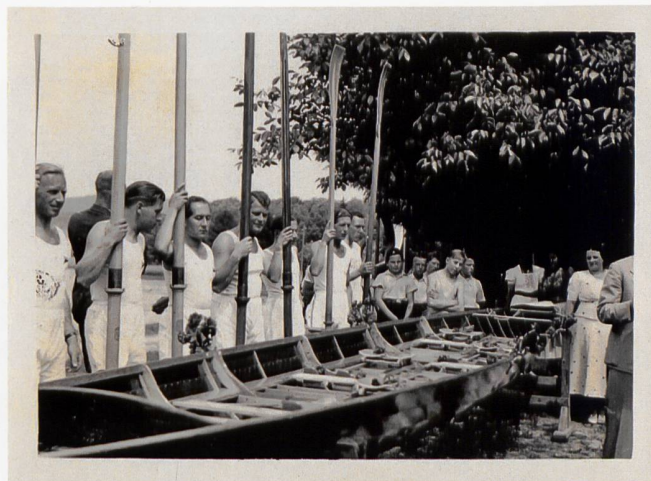
Bootstaufe im Jahre 1937.