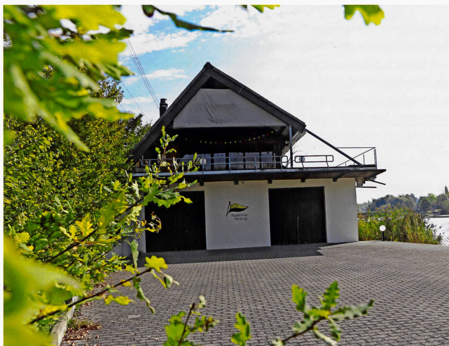
Der Neubau des Bootshauses im Jahre 1968 ist ein gelungenes Beispiel eines Zweckbaus.