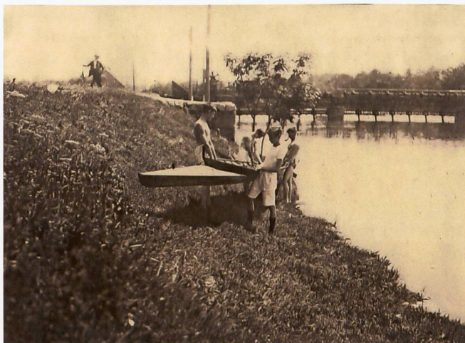
Umwässern des Basilisk 1922.