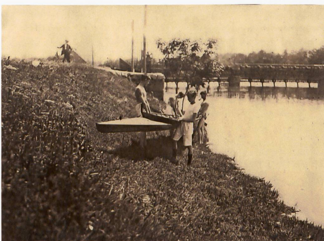
Umwässern des Basilisk 1922.

Im Gründungsjahr wurden insgesamt 20 Fahrten ausgeführt, im zweiten Vereinsjahr schief die Rudertätigkeit ein. Erst 1922 wurden wieder acht Fahrten registriert. Am 28. Oktober 1922 fand auf Initiative von Paul Morf eine zweite Grün-