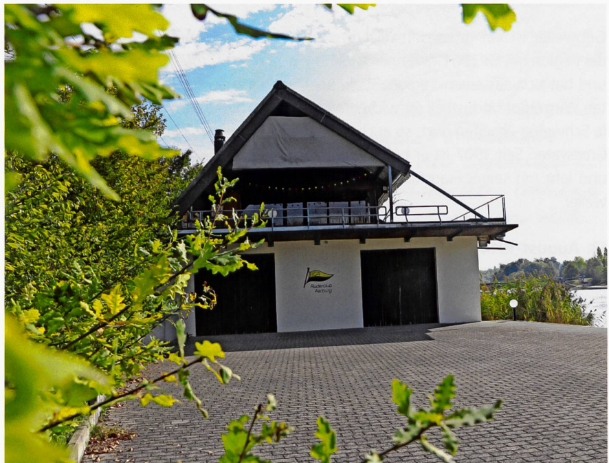
Der Neubau des Bootshauses im Jahre 1968 ist ein gelungenes Beispiel eines Zweckbaus.