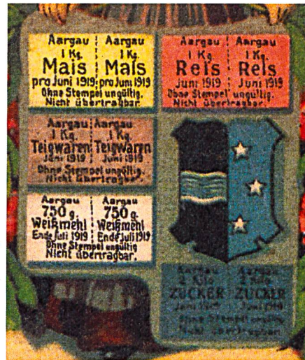
Lebensmittelkarte aus dem Ersten Weltkrieg (aus: Heimatkunde des Wiggertals 2014)

chens seit erdenklichen Zeiten das charakteristische Gepräge.» (2)