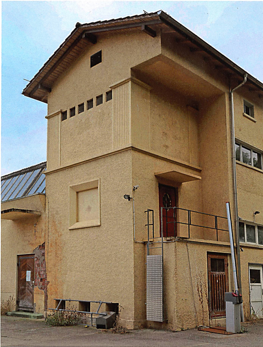
Die Transformatorenstation bei der ehemaligen Gerberei Hagnauer ist heute noch in Betrieb.