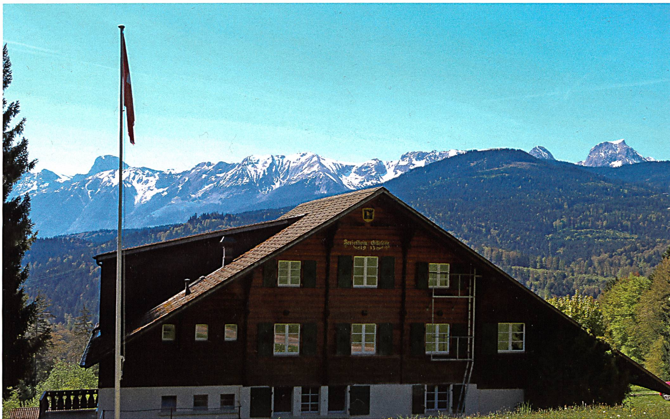
Haus von Norden.