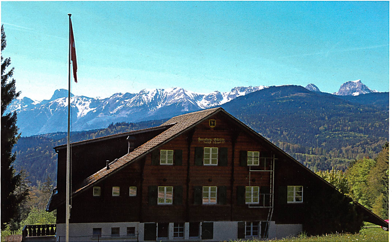
Haus von Norden.