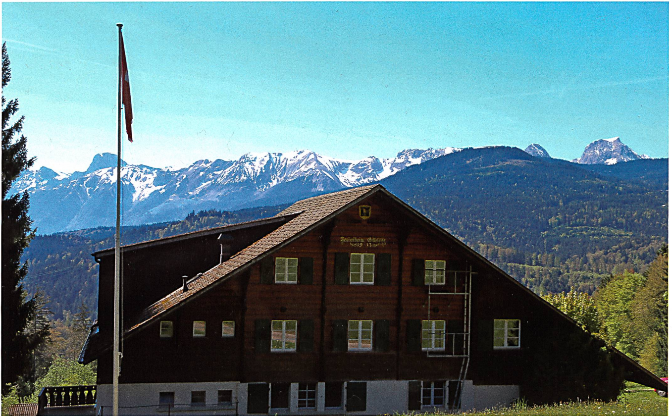
Haus von Norden.