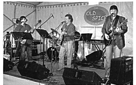
. . . und im Tunnel-Pub.