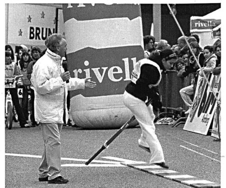
Schüler-Olympiade zwischen den beiden Tunnels . . .