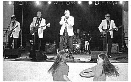
Top-Unterhaltung im Festzelt . . .