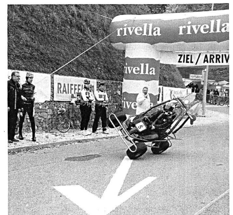
Akrobatik mit einem Kart.