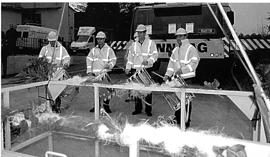
Tambouren beim Zapfenstreich.