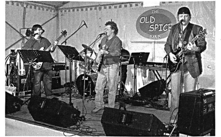
. . . und im Tunnel-Pub.