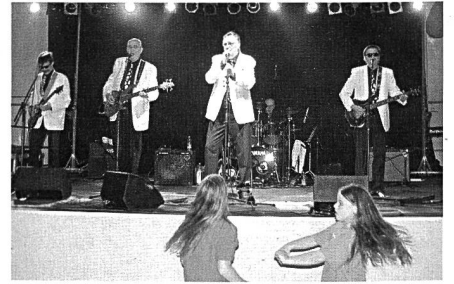
Top-Unterhaltung im Festzelt . . .