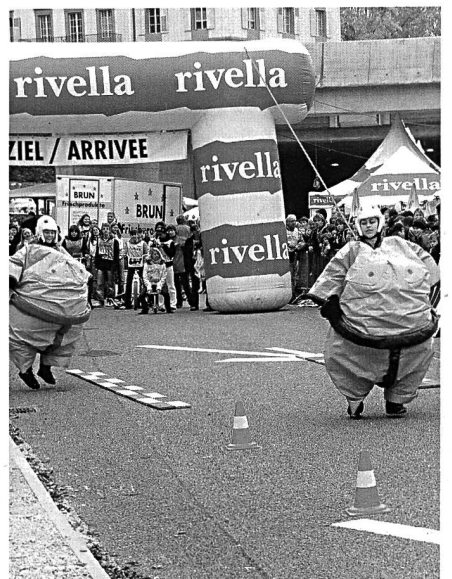
. . . mit grossem Einsatz und viel Spass.