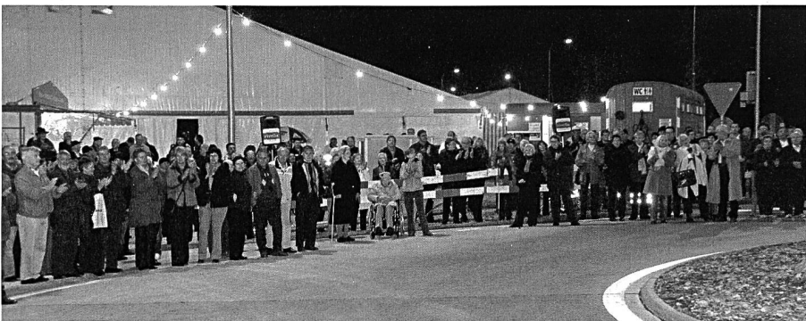
. . . . unter grosser Beteiligung der Bevölkerung.