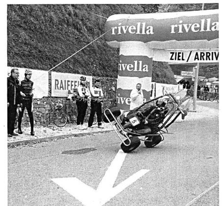
Akrobatik mit einem Kart.