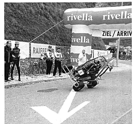
Akrobatik mit einem Kart.