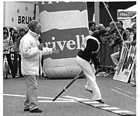
Schüler-Olymiade zwischen den beiden Tunnels . . .