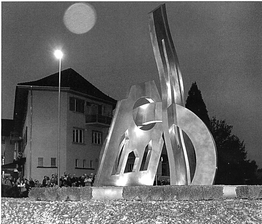
Gute Stimmung bei der Enthüllung der Kunst im Kreisel . . .