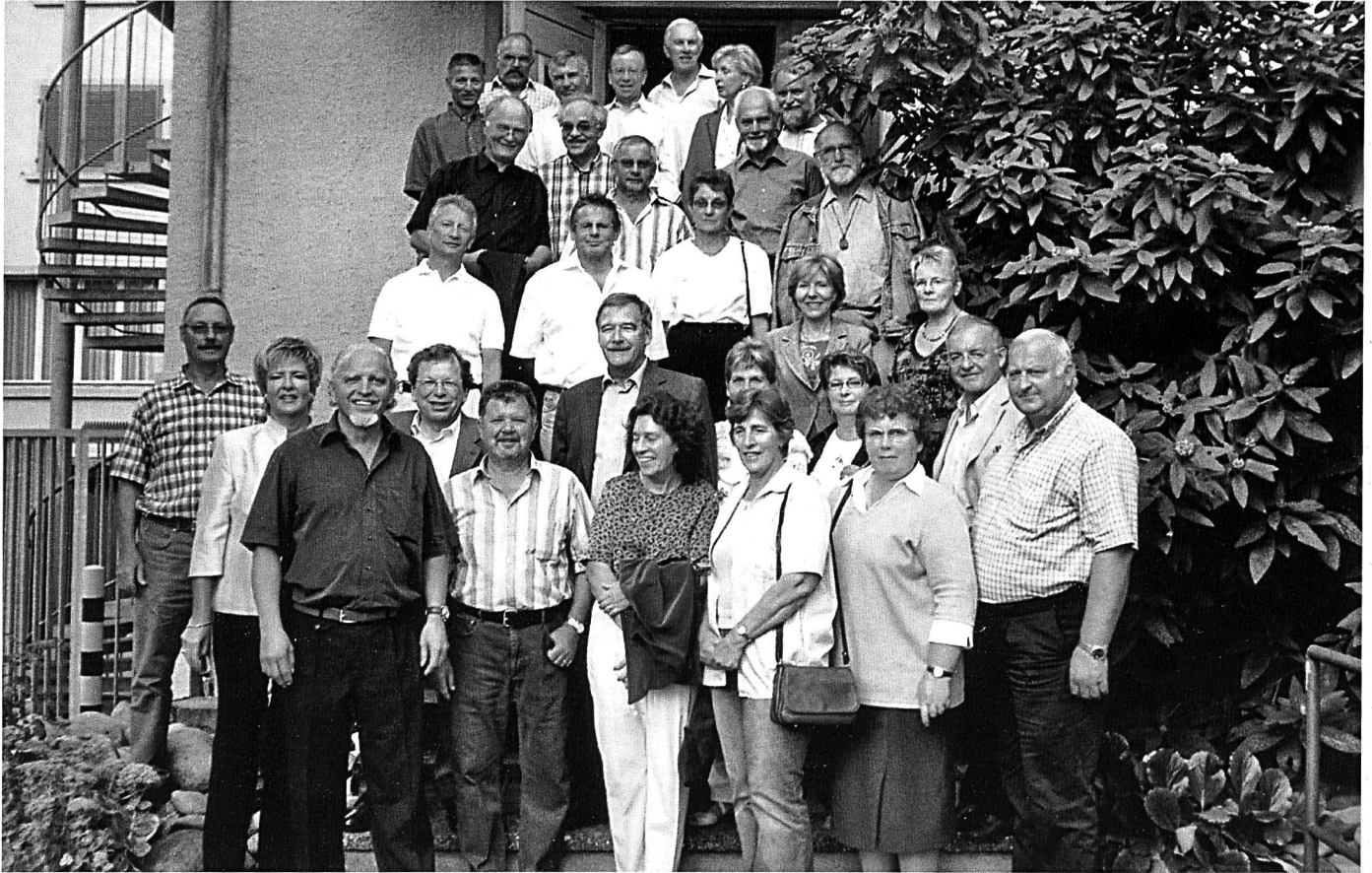
Die Teilnehmer am Jahrgängertreffen 2006 hinter dem Hotel Krone.

Es ist nicht nur in Aarburg, sondern vielerorts, Tradition, dass sich Jahrgänger und/oder ehemalige Schulkameradinnen und -kameraden in verschiedenen zeitlichen Abständen am ehemaligen Schul-/Wohnort treffen. Ein guter Grund, im Neujahrsblatt eine kleine Dokumentation mit Fotos aus vergangenen Zeiten zu präsentieren. Eingeladen sind Jahrgänge die ein rundes Treffen, ab 60 Jahren, feiern.