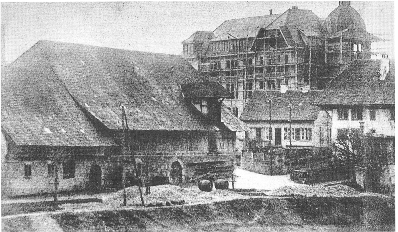
Das Schulhaus Hofmatt während den Bauarbeiten.

gebäude zu kaufen zum Preise von Fr. 42 000.—.