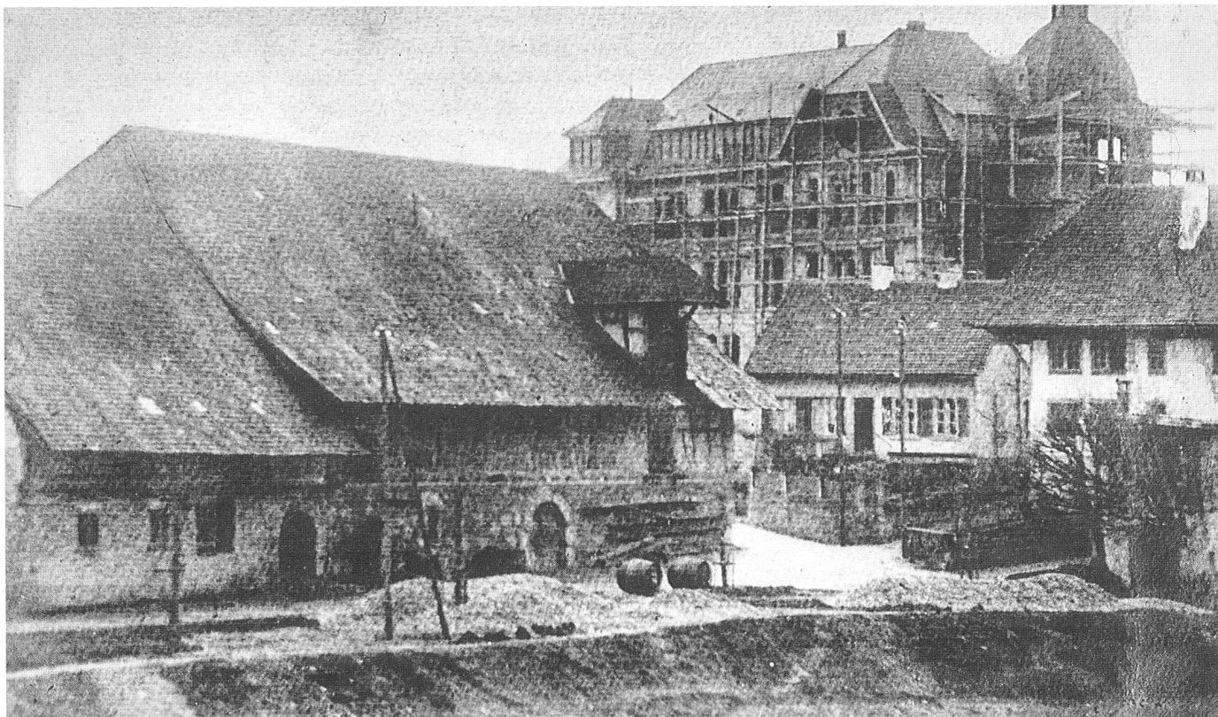
Das Schulhaus Hofmatt während den Bauarbeiten.

gebäude zu kaufen zum Preise von Fr. 42 000.—.