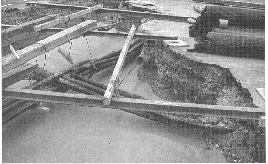
Fertig verlegte Abdichtungsfolie unter bestehenden Werkleitungen.