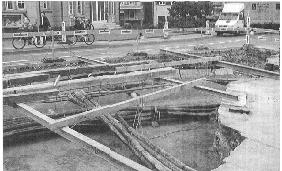
Schutzmörtel über Abdichtung und unter gesicherten Werkleitungen.