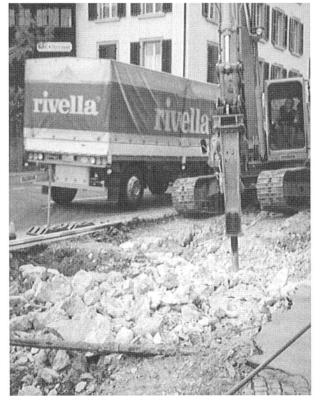
Oft war Felsabbau notwendig.