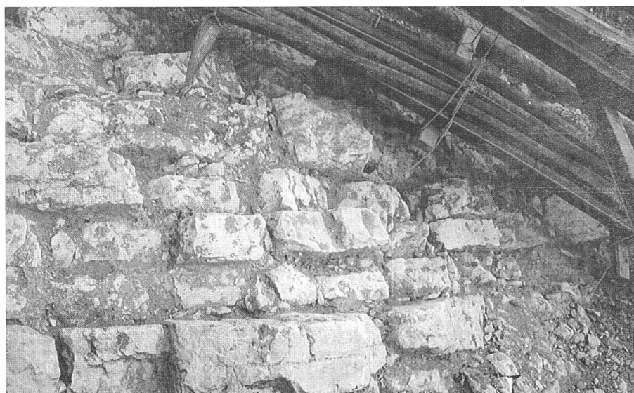
Das freigelegte und sauber gereinigte Bruchsteingewölbe.