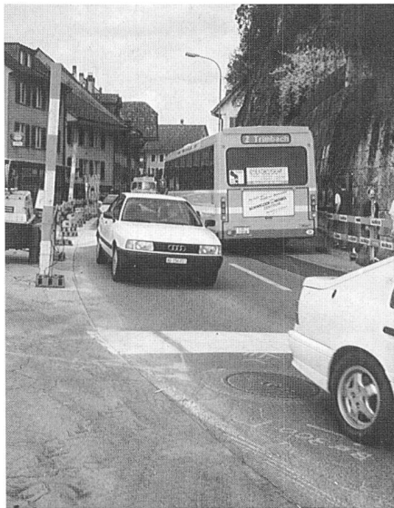
Gefordert war allseitige Toleranz.