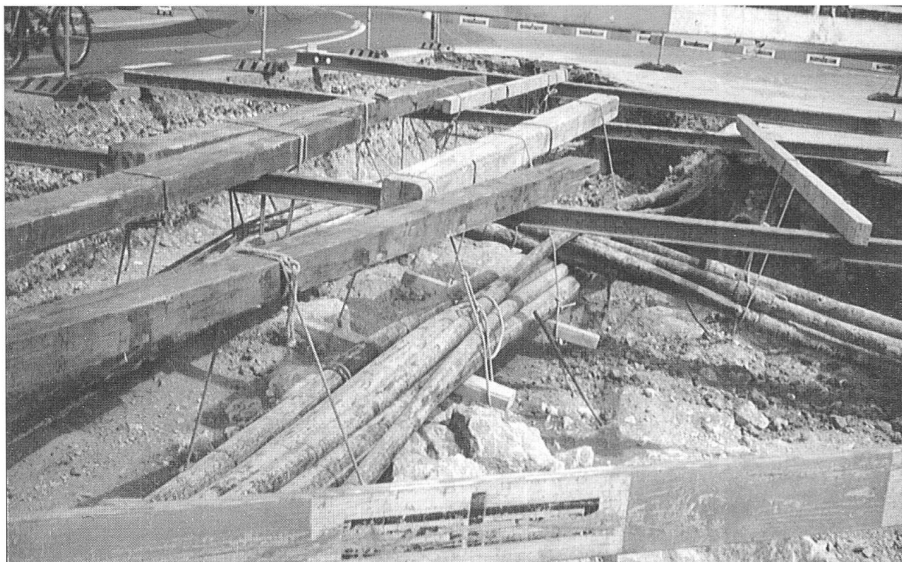
Die gesicherten Werkleitungen.