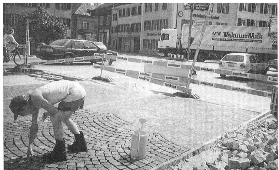
Pflasterungsarbeiten bei der Bushaltestelle Stadtgarten.