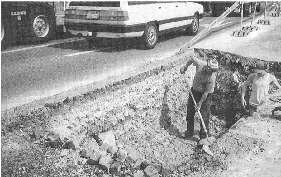
Freilegen des Tyrgewölbes neben täglich rund 29 000 Fahrzeugen mit vielen Abgasen.