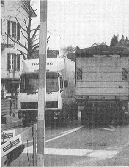
Manchmal wurde das Kreuzen schwierig.