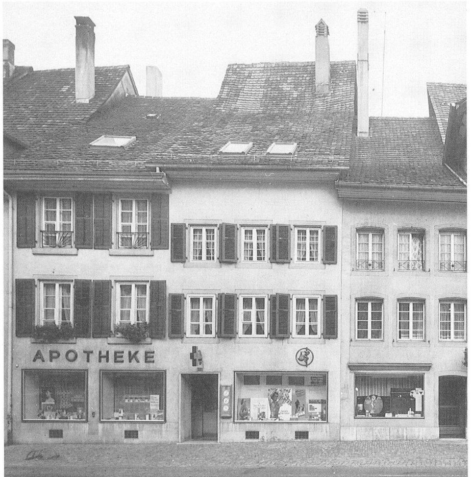
Die Apotheke Aarburg in den siebziger Jahren.

Schon in der Mittelschule und dann erst recht an der Hochschule wurde