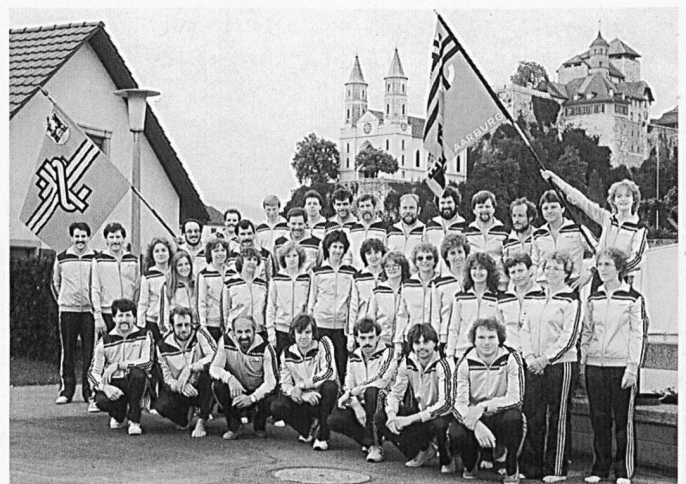
Turnerinnen und Turner im Mai 1983 im neuen Vereinstrainer.