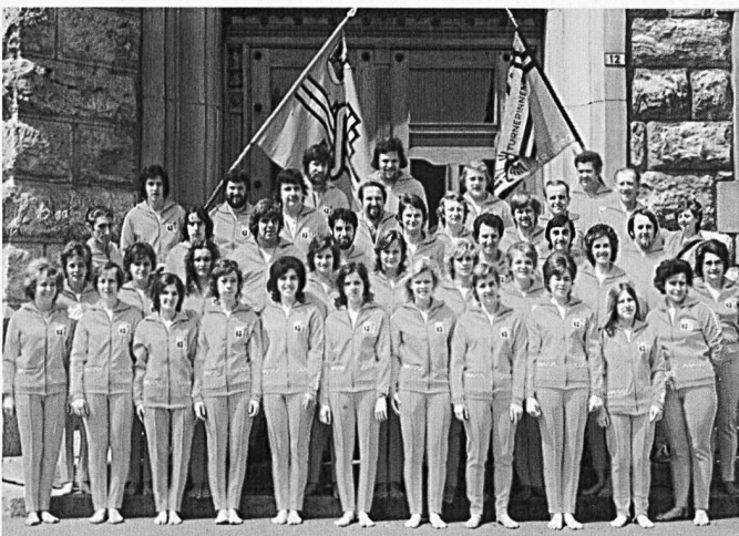
SATUS-Turner und -Turnerinnen im ersten gemeinsamen Vereinstrainer im Jahre 1974.