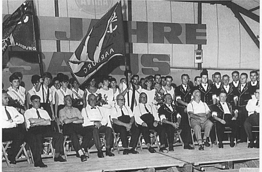
Turnerinnen, Frauenriege, Turner und Jodler hinter den verdienstvollen Ehrenmitgliedern am Jubiläum mit Fahnenweihe im Jahre 1967.