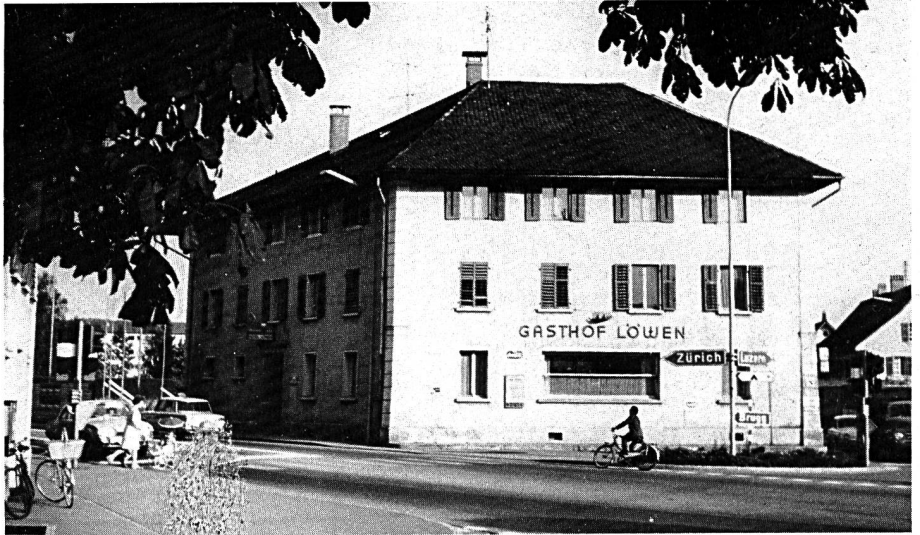
Ansicht des «Gasthof Löwen» im Jahre 1966. Das Gebäude diente bis zum endgültigen Ab-