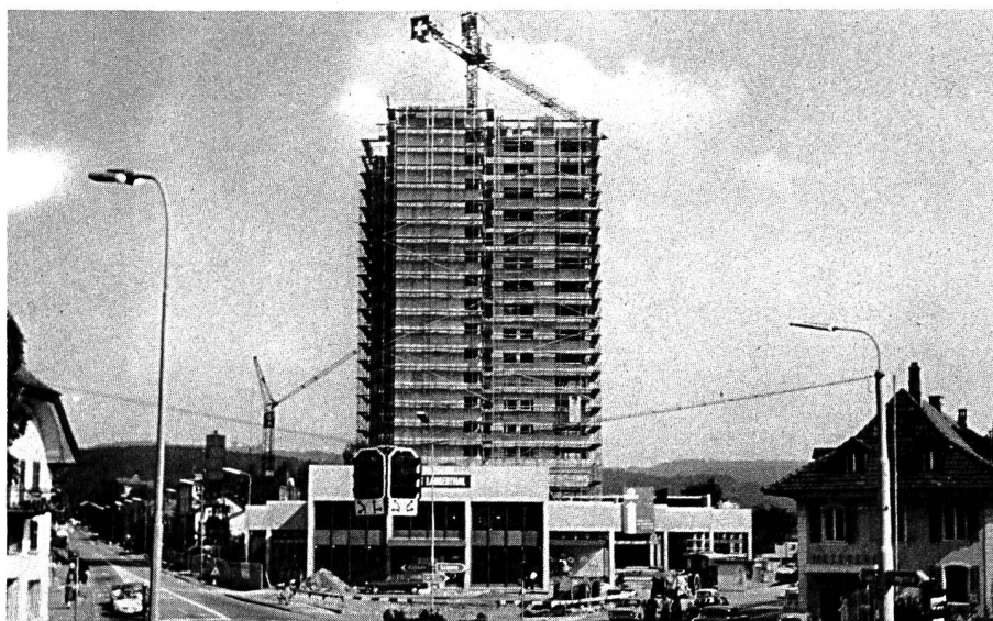
Das neue Wahrzeichen von Oftringen nimmt Gestalt an. Verschwunden ist der ehemalige

Gasthof Löwen mit dem Saalbau, dem Zentrum des Oftringer Vereins- und Theaterlebens.