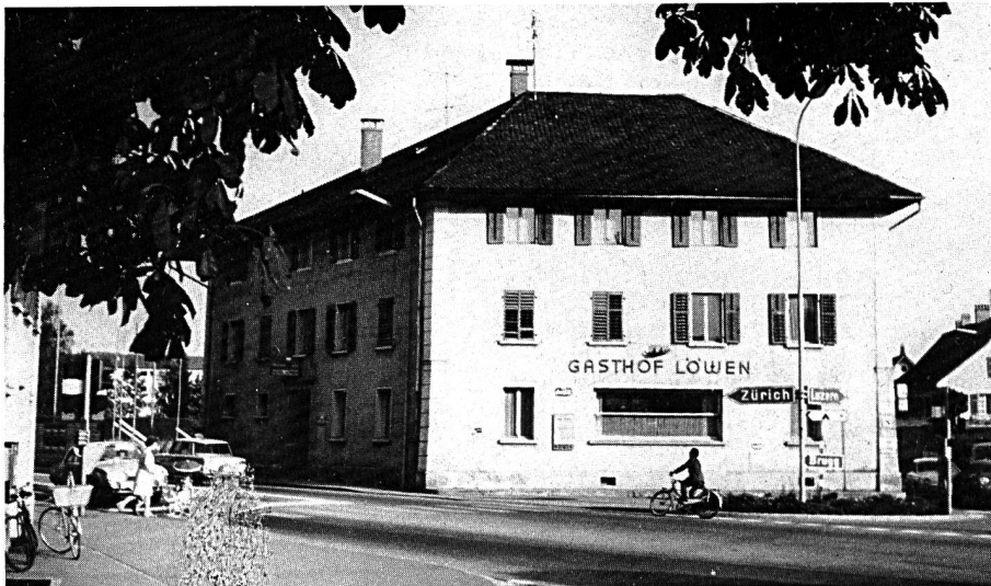
Ansicht des «Gasthof Löwen» im Jahre 1966. Das Gebäude diente bis zum endgültigen Ab-

Die Schweizerische Nationalbahngesellschaft gelangte jedoch mit dem Projekt Suhr—Zofingen—Herzogenbuchsee an die Öffentlichkeit. Für Oftringen war jedoch keine Station mehr vorgesehen, gleichwohl verlangte man eine finanzielle Beteiligung von Fr. 30 000.— was von der Gemeindeversammlung aber verweigert wurde. Der Gedanke der Schaffung eines Bahnhofes in der Nähe der Kreuzstrasse wurde nicht aufgegeben. Nachdem die Ortsbürgergemeindeversammlung vom 10. Oktober 1875 einen Antrag von Ad. Lang-Zürcher abgelehnt hatte, ernannte die Einwohnergemeindeversammlung vom 23. Januar 1876 ein Komitee, das sich mit der Angelegenheit ernstlich befassen musste. Die Bestrebungen verliefen aber im Sande. Lange Zeit war es nun um die Bahnhoffrage stille gewesen. Als dann kurz vor Ausbruch des Zweiten Weltkrieges die SBB die Unterführung in Aarburg und die Überführung Kreuzstrasse bauten, hegte man wieder Hoffnungen, in Oftringen doch noch eine Haltestelle zu erhalten. Doch ein diesbezügliches Gesuch wurde von Bern abgewiesen, da die Entfernung von der Station Aarburg zu klein sei. Als 1947 von der Eröffnung einer Autobusverbindung Zofingen—Rothrist die Rede war, versuchten die Anhänger des Bahnverkehrs einen letzten Anlauf, um