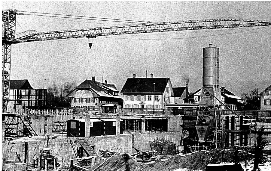
Unter Zuhilfenahme modernster Maschinen schreiten die Bauarbeiten rasch voran. Am