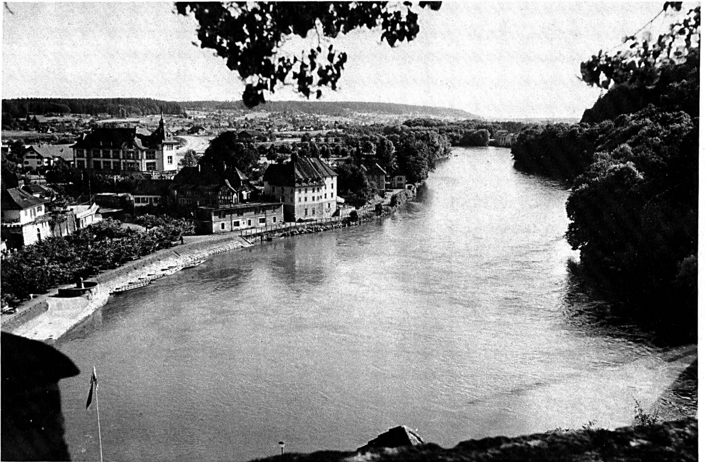
Die überdimensionierte Eisenbahnbrücke des generellen Projektes 1966 hätte die Aare von der Badeanstalt im Hintergrund links bis zum bewaldeten Steilufer im Vordergrund rechts überquert. Gemäss neuer Projektvariante wird die Brücke flussaufwärts verschoben und wesentlich verkürzt (siehe Planskizze).

schen Probleme für die Erstellung eines Borntunnels zwar nicht unüberwindbar seien, jedoch mit gewissen Erschwernissen und entsprechenden Mehrkosten zu rechnen sei. Bei Gesamtkosten für die neue Doppelspur nach generellem Projekt 1966 im Betrage von 60 Millionen Franken (Preisbasis 1971) wird der Mehraufwand für die Tunnelvariante auf 17 Millionen Franken berechnet.