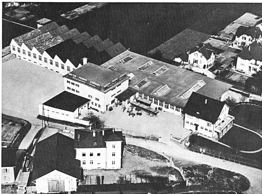
Fabrikareal im Jahre 1947.