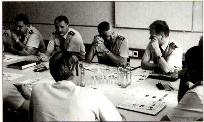
Der CdA mit dem SCOS (zur Rechten) im Seminar mit seinen Höheren Stabsoffizieren.