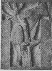
Abb. 1. Ornamentdetail eines Kämpfers.

Infolge der Bevölkerungszunahme der Vorstädte von Bern, die kirchlich noch zu der Altstadt gehörten, machte sich der Wunsch immer mehr geltend, die Aussenquartiere zu selbständigen Kirchgemeinden mit eigenen Kirchen zu erheben. Diesem Bedürfnis folgend ist zu Anfang der 90er Jahre in der Lorraine eine Kirche erbaut und das Quartier als selbständige Kirchgemeinde von der Nydeckgemeinde losgelöst worden. Doch auch in den andern Quartieren wurde diese Notwendigkeit immer fühlbarer und liess hauptsächlich die Abtrennung der Länggasse von der Heiliggeistgemeinde, die über 25 000 Seelen zählte, als in erster Linie notwendig erscheinen.