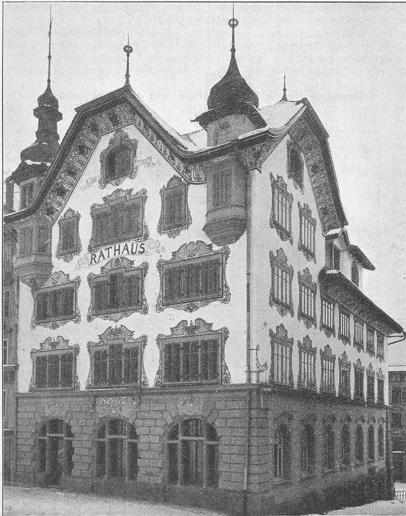
Das Rathaus zu Einsiedeln nach dem Umbau.

Umgebaut von Architekt A. Huber in Zürich.