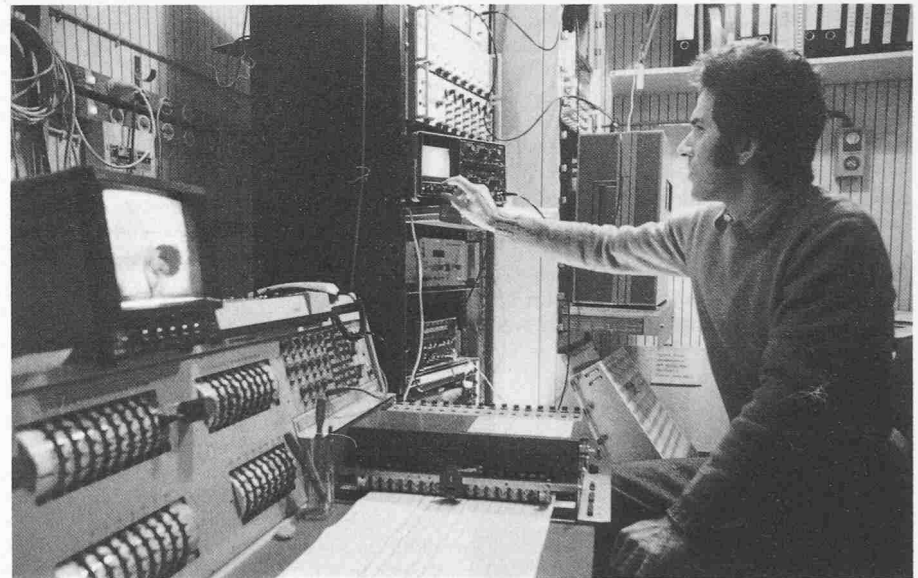
Im Schlaflabor des Münchner Max-Planck-Instituts für Psychiatrie: Über einen Monitor kann die im Nebenraum schlafende Versuchsperson beobachtet werden. Der Mehrkanal-Schreiber im Vordergrund zeichnet die für den Schlafverlauf charakteristischen Grössen auf: Augenbewegungen, Tonus der Kinnmuskulatur und Elektroenzephalogramm

ten mit eher langweiligen Beschäftigungen ausfüllen.