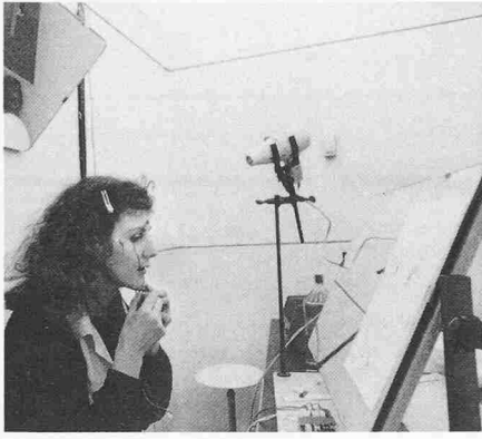
Im unterirdischen Bunker bleiben die Versuchspersonen vier Wochen ohne jede Zeitinformation von der Aussenwelt isoliert. Vor dem Schlafengehen müssen sie sich selbst die verschiedenen Elektroden aufkleben, die den Wissenschaftlern dann Auskunft über die Augenbewegungen, den Muskeltonus und die Hirnströme während des Schlafs liefern

Hell-Dunkel-Wechsel, weicht der Ruhe-Aktivitäts-Zyklus vom Normaltag ab. Seine Periode liegt dann um 25 Stunden. Es fiel ferner auf, dass die Versuchspersonen, obschon sie keinerlei Zeitinformation besitzen, regelmässig zu Bett gehen und noch regelmässiger wieder aufwachen – was eindeutig auf innere Uhren als Zeitmesser hinweist.»