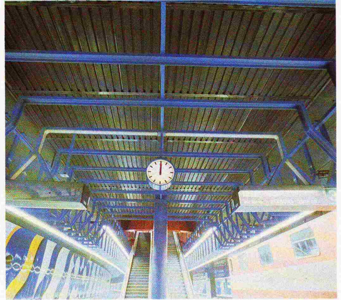
Bild 4. Rippenkonstruktion über dem Perrongeschoss