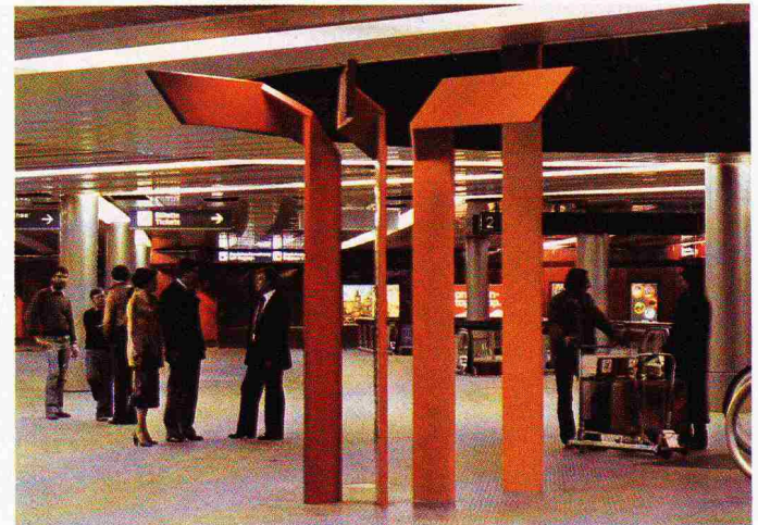
Bild 7. Bahnhofshalle

(Bild 5). In ihr wurde grosses Gewicht auf eine gute Ausstattung sowie einen sorgfältig durchgestalteten Innenausbau gelegt.