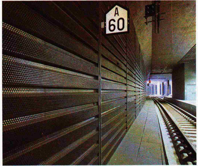
Bild 10. Schallschutzwand im Bereich des Gepäckkaulades

Bahnhofhalle-Geschosses zusammengefasst (Bild 8). Besonders umfangreich und kompliziert sind die Lüftungs-, Kälte- und Elektroeinrichtungen. Ein ausgefeiltes Energiekonzept mit Grundlast Bodenheizung, Klima- und Wärmerückgewinnungsanlagen sichert einen sparsamen Betrieb. So werden heute nur 2,5 Mio Kcal benötigt anstatt der ursprünglich, d.h. zur Zeit, als man allgemein noch weniger energiebewusst plante, berechneten 6 Mio. Schwierige technische Probleme waren auch zu lösen bezüglich Wasserversorgung, Entwässerung, Pumpstationen, Brand- und Personenschutz (Notzufahrten und -ausgänge) und Sicherheitseinrichtun-